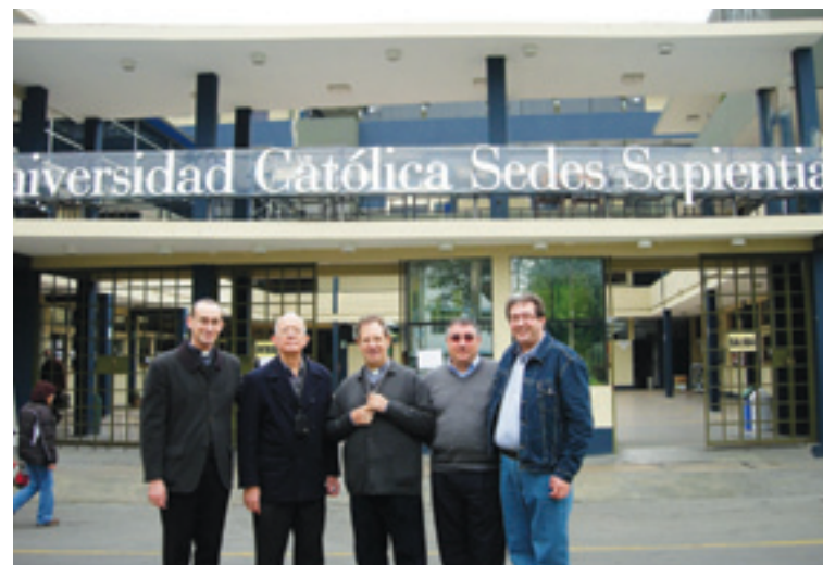
Ante la Universidad Católica Sedes Sapientiae.

acogiendo y acompañando. Ahora queda lo más importante, asumir lo vivido e intentar seguir dando respuesta desde nuestra diócesis de Orihuela-Alicante a tanta necesidad y demanda con la que nos hemos ido encontrando en los distintos lugares a través de sus obispos, de los misioneros y de la propia gente. Tarea en la que seguimos trabajando desde aquí y que se la encomendamos a Dios.