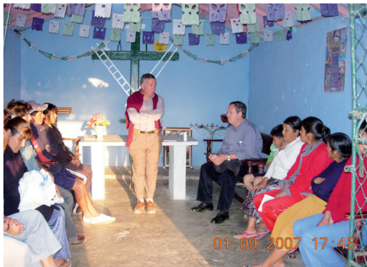
En la charla prebautismal.

Tras la visita a Pariacoto, nos centramos en conocer Casma y su realidad, y por mi parte encontrarme con la gente querida con la que durante cinco años compartí mi vida personal y mi ministerio sacerdotal; pudimos visitar algunas de las comunidades rurales como el Establo, donde celebramos la eucaristía en la nueva capilla que habían construido, San Diego donde pudimos estar con un grupo de padres que tenían su charla prebautismal, acompañamos a un difunto en el velatorio en Tabón y visitamos a la catequista de Puerto Casma que estaba enferma, Jaihua donde visitamos la capilla nueva y por último Huanchuy donde quedaba por techar la capilla, para lo cual nos pidieron ayuda. Además, en la ciudad de Casma visitamos también algunos asenta-