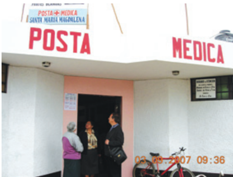
Posta médica Santa María Magdalena.