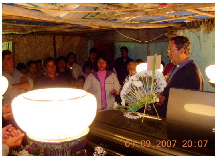
Velatorio en Tabón.