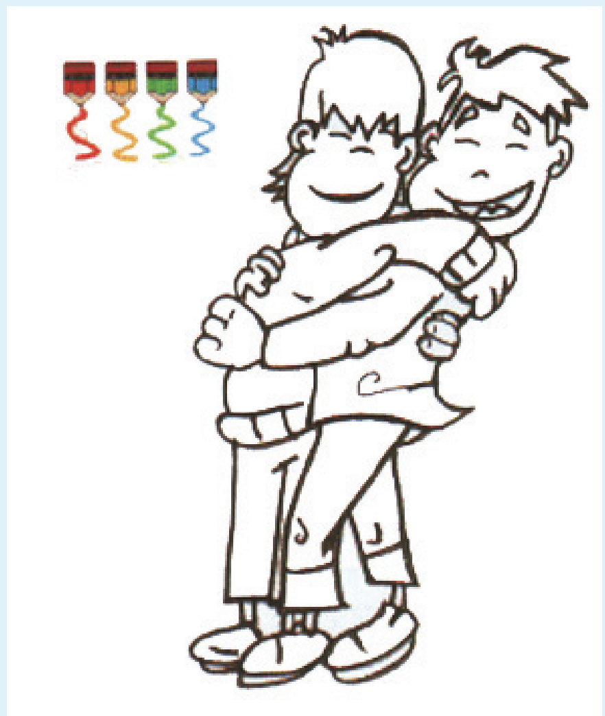
Colorea este dibujo de los dos hermanos.