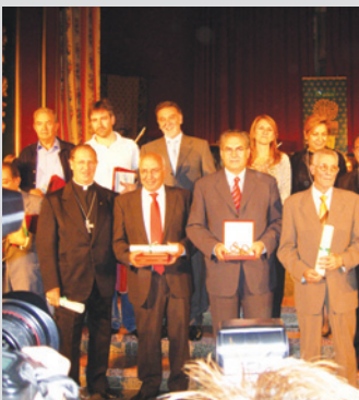
Zamora premia a nuestro Obispo. Pág. 12.