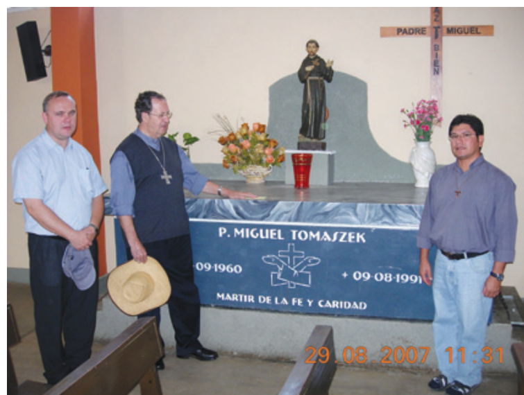
Junto a las tumbas de los mártires, en el templo parroquial de Pariacoto.