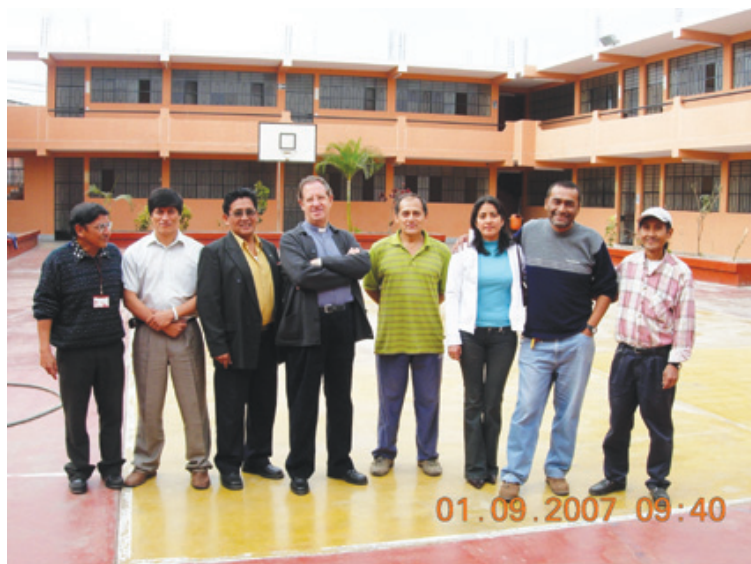
En el colegio Santa María Goretti, en Cuzco.