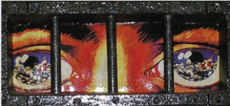
Descubriendo el rostro de Cristo en cada persona. Pág. 6.