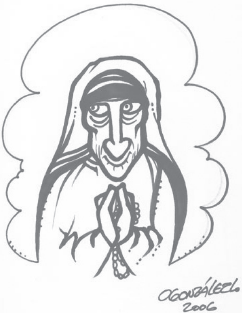
Colorea este dibujo de la madre Teresa.