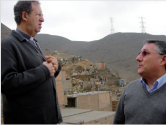
Visita a nuestros misioneros en Perú. Págs. 3 y 4.