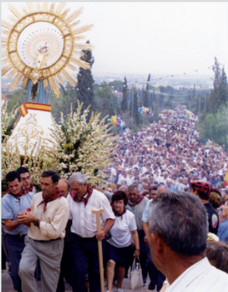
Romería de la Virgen del Pilar en Banejúzar. Pág. 9.