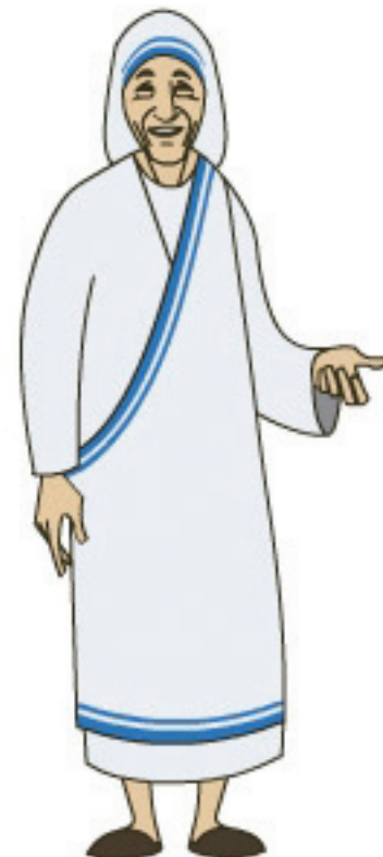
TERESA DE CALCUTA