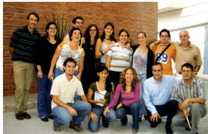
Iniciación a la HOAC.