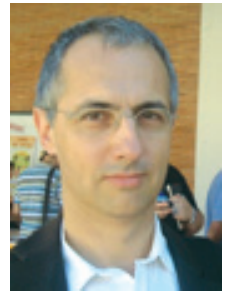
FRANCESC ARACIL Col·lectiu de Cristians Valencians d'Elx-Baix Vinalopó

El 1850 es traslladà a l'illa de Cuba, ja que va ser nomenat arquebisbe de la ciutat de Santiago. Exercí este ministeri amb la seua inesgotable energia, fundant una institució religiosa femenina, entitats públiques, i reformant la vida del clero, però tornà a Espanya, cridat per la reina Isabel II, que l'havia nomenat el seu confessor. No l'entusiasma-va la vida de la cort, però treballà en projectes com la revitalització del monestir