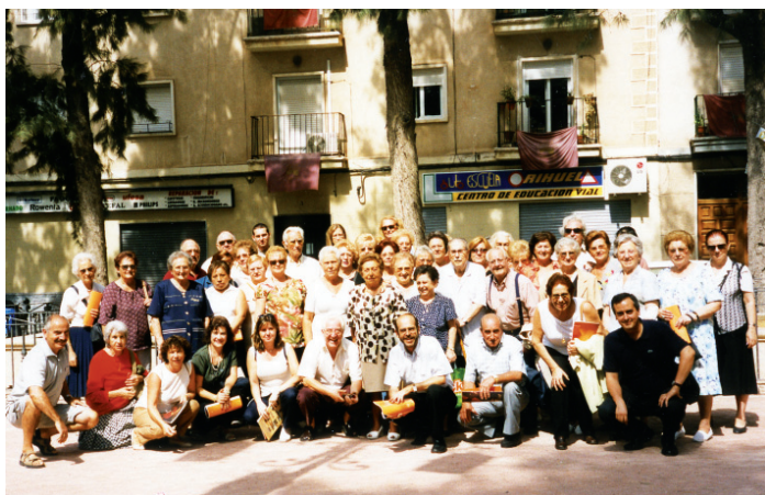
Excursión: Luz de la Imágenes.