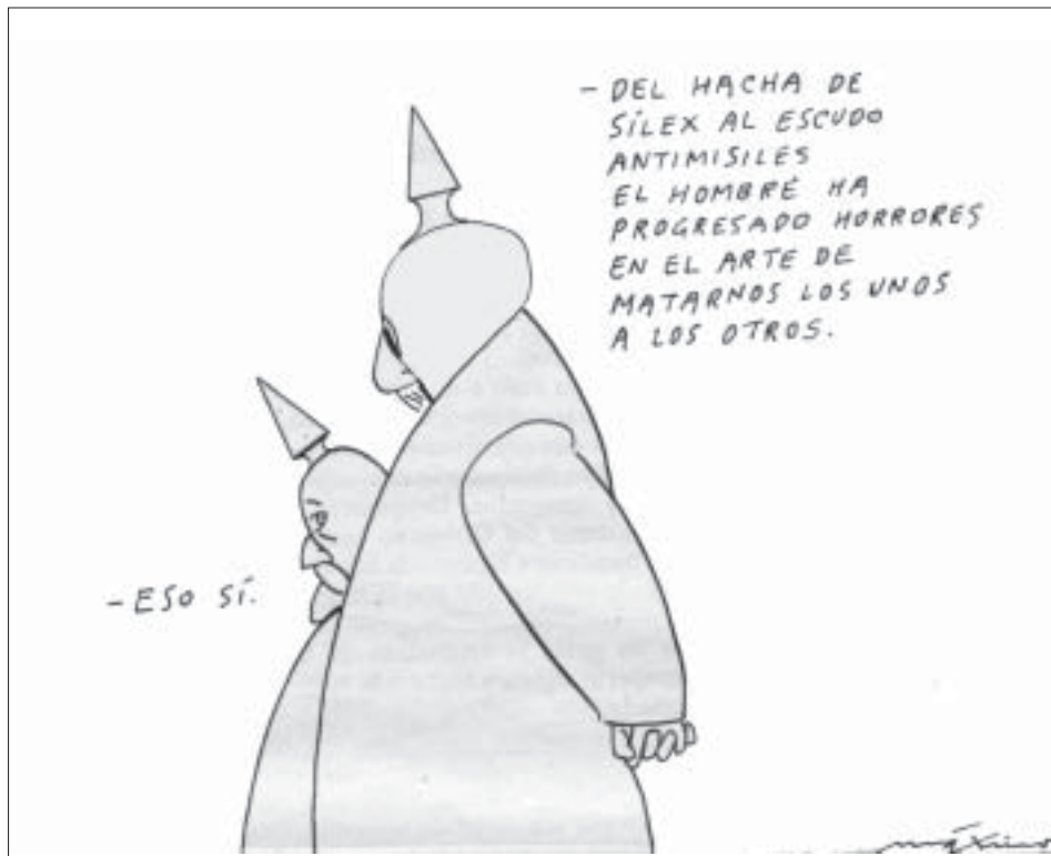
MÁXIMO (El País)