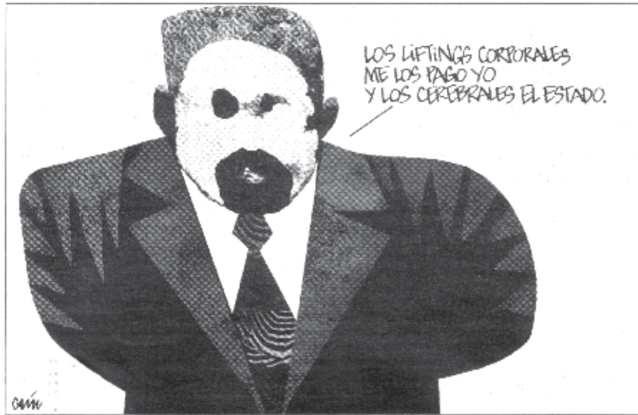
CAÍN (La Razón)