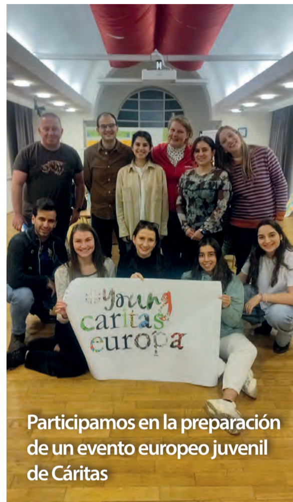
Participamos en la preparación de un evento europeo juvenil de Cáritas

Para finalizar esta magnífica jornada, todos los asistentes se pudieron sumar a los bailes a ritmo de Batucada. Sin duda, un buen final para un gran día de encuentro en familia que nos recuerda que Cáritas Diocesana late con fuerza y sigue haciendo camino al lado de las personas más vulnerables.