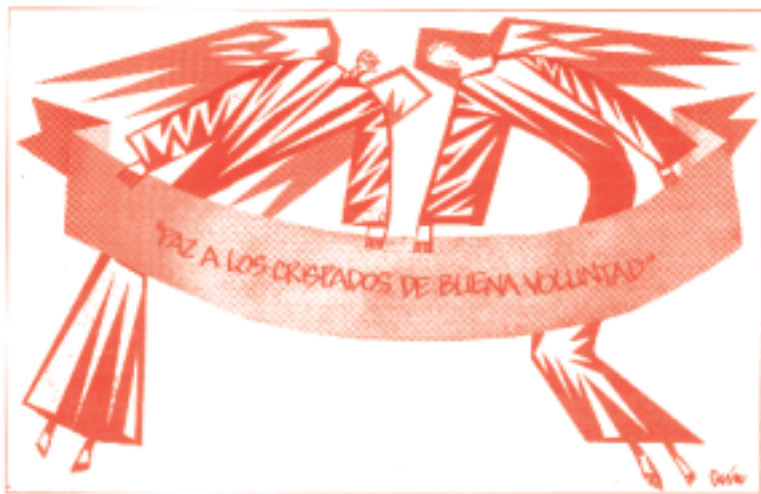
CAIN (La Razón)