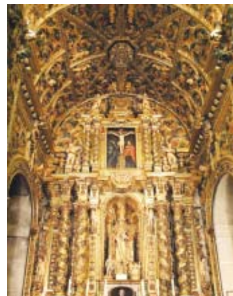
Retablo de San Nicolás.