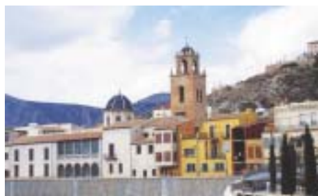
Catedral y Palacio Episcopal.

Tomar conciencia de lo que somos, también como cristianos, y vivir en consecuencia, es algo que ilumina la vida de las personas, orienta sus pasos y ayuda a mejorar la convivencia. «La apertura a Dios y al hombre —he leído recientemente— determina la convivencia en sociedad».