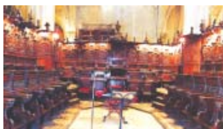
Coro de la Catedral.

El Catecismo de la Iglesia Católica recuerda que Iglesia particular o Diócesis —en nuestro caso la nuestra, Orihuela-Alicante— es una comunidad de fieles cristianos en comunión en la fe y en los sacramentos con su Obispo, ordenado en la sucesión apostólica. Como Vicario de Cristo, cada Obispo desempeñamos el oficio pastoral de la Iglesia particular que el Santo Padre nos ha confiado, pero tiene, al mismo tiempo, colegialmente con los demás hermanos en el episcopado la solicitud por todas las Iglesias . «Si todo Obispo es propio —aseguraba Pío XII— solamente de la porción de grey confiada a sus cui-