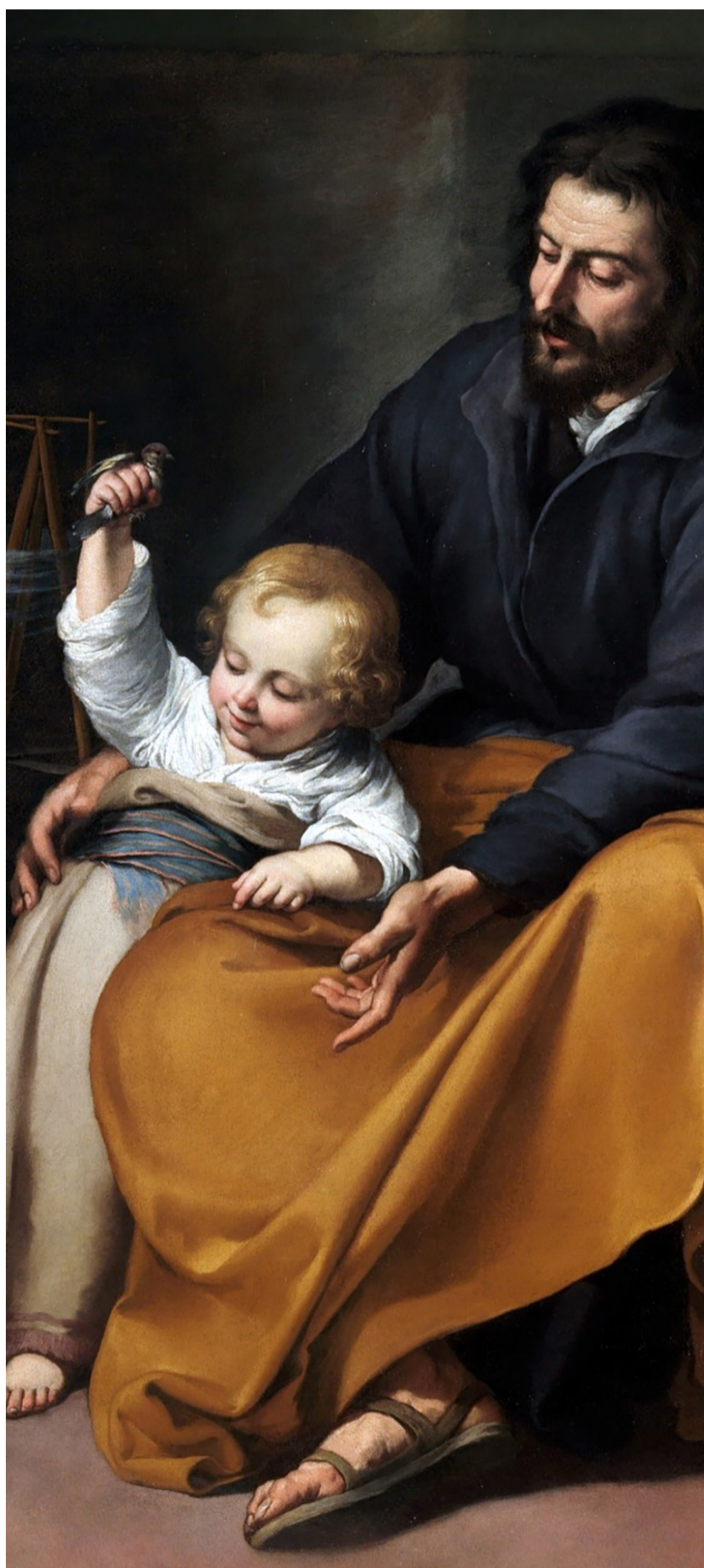
Detalle de Sagrada Familia del pajarito. Óleo sobre lienzo de Bartolomé Esteban Murillo. Museo del Prado.