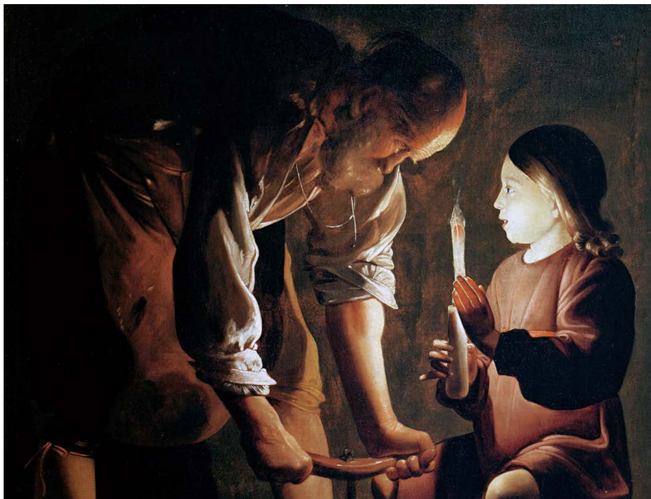
San José carpintero

Obra de Georges de La Tour. Óleo sobre lienzo pintado en la década de 1640. Museo del Louvre, París.