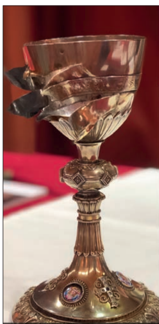
Celebraciones que contarán con la presencia del cáliz recuperado de una de las iglesias profanadas.

Pese a las circunstancias, la Eucaristía de las 19:30h en el Templo Arciprestal se revestirá de un tono solemne, pero a la vez, entrañable al quedar protagonizada por este gesto de devoción popular. Todos los niños y niñas que sean presentados a la Virgen recibirán un recuerdo de este momento.