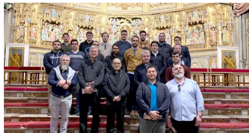
Imagen de la peregrinación del Teologado de Alicante a Toledo:

Esa noche, la verdad, llegué a sentir miedo. Miedo por no saber cómo acercar a Cristo a la gente que viniese a visitarlo, por no estar a la altura de ser una buena discípula... ¿Pero sabéis qué? Que el Señor esa noche estuvo conmigo, que era Él el que hablaba a través de mí, y el gran amor que tenía en mi corazón al finalizar la actividad y que, de hecho, he seguido teniendo los días posteriores, es mucho más grande que ese nerviosismo, miedo e incluso dudas que te puede surgir.