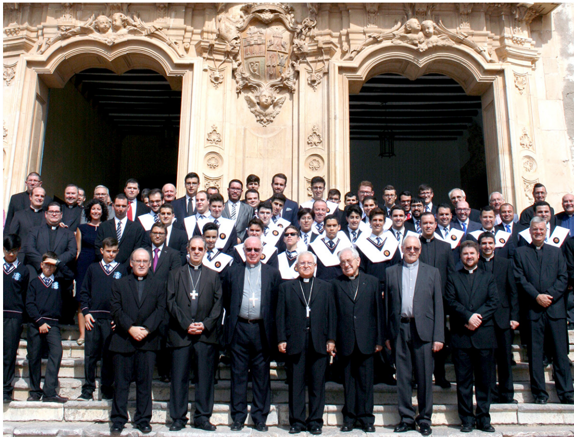
D. Jesús en el Seminario Diocesano acompañado de los seminaristas, formadores y obispos eméritos