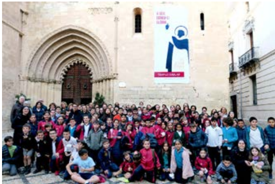
Encuentro de Niños

El pasado 1 de marzo celebramos un Encuentro de Jóvenes con motivo del año Jubilar de San Vicente Ferrer. En este encuentro participaron los jóvenes de las distintas parroquias de Orihuela, fue una tarde donde profundizamos acerca de las virtudes del santo y también tuvimos un tiempo para integrarnos y compartir. Asimismo contamos con el apoyo del jóvenes del Seminario Menor. Además, el 20 de marzo, una vez más, las parroquias de Orihuela nos reunimos en la Santa Iglesia Catedral para el encuentro de niños con motivo del año Jubilar de San Vicente Ferrer. Le damos gracias a Dios por darnos esta oportunidad de compartir como miembros de la gran familia que es la Iglesia Católica.