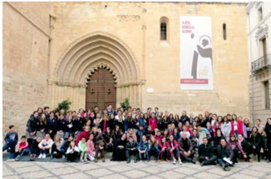
Encuentro de Jóvenes