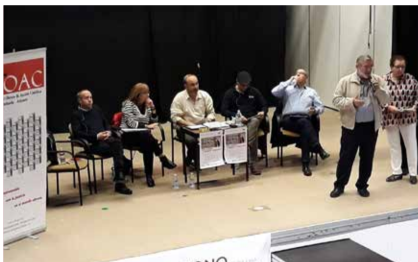
// Uno de los momentos de las Jornadas de la Hoac celebradas en Elche durante la participación

Convocadas por la HOAC de Orihuela-Alicante, el sábado 27 de octubre de 2018, unas 200 personas, se reunieron en el Colegio Salesiano de San Rafael de Elche, para celebrar una jornada de reflexión y debate bajo el título de «Otras economías al servicio de la persona».