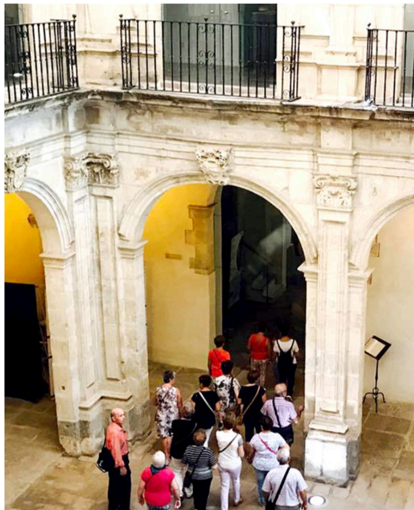
· Claustro del Museo Diocesano de Arte Sacro, Orihuela

La Diócesis de Orihuela-Alicante sorprende por su amplia oferta de turismo religioso que incluye desde un Museo de Arte Sacro de primer orden europeo hasta un Patrimonio de la Humanidad