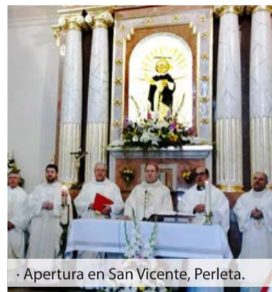
· Apertura en San Vicente, Perleta.