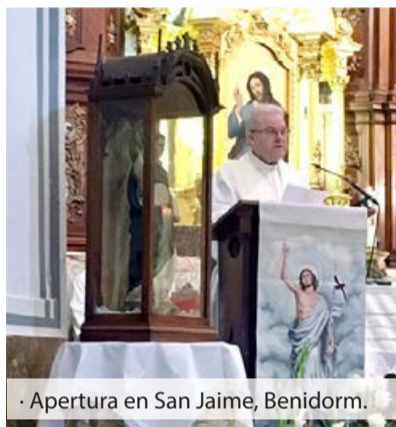
· Apertura en San Jaime, Benidorm.