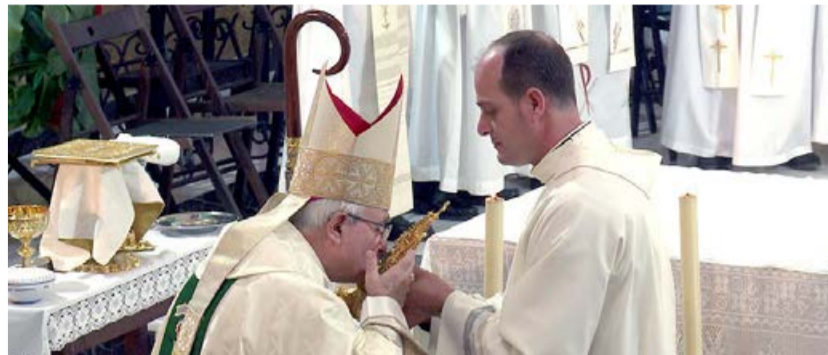
· Apertura del Jubileo en San Vicente Ferrer, de San Vicente del Raspeig

«Pido al Señor que este tiempo jubilar venga a sumar luz y ánimos a la tarea evangelizadora que todos debemos llevar a cabo, desde la renovación personal y eclesial por el encuentro con el Señor, la conversión a Él de nuestras mentes y voluntades y la comunión creciente que deseamos dentro y fuera de nuestra Iglesia» concluye.