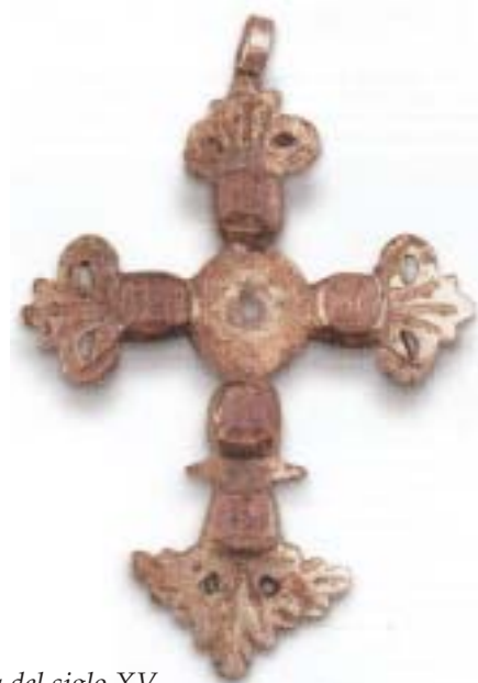
Cruz de alpaca floreada del siglo XV. Castillo de Tibi.

Cruz de alpaca con terminación vegetal en sus extremos y con cinco ópalos engastados. Posee anilla para colgar en su extremo superior y un orificio circular en el centro de la cruz. La cruz apareció en el transcurso de las excavaciones llevadas a cabo en el castillo de Tibi y gracias a ellas sabemos que el castillo se abandonó inmediatamente después de la guerra entre los dos Pedros, es decir en el último tercio del siglo XIV. Pero la tipología formal y la decoración de la cruz sugieren una cronología más moderna, quizás del siglo XV. Actualmente se encuentra en el Museo Arqueológico Provincial de Alicante (MARQ).