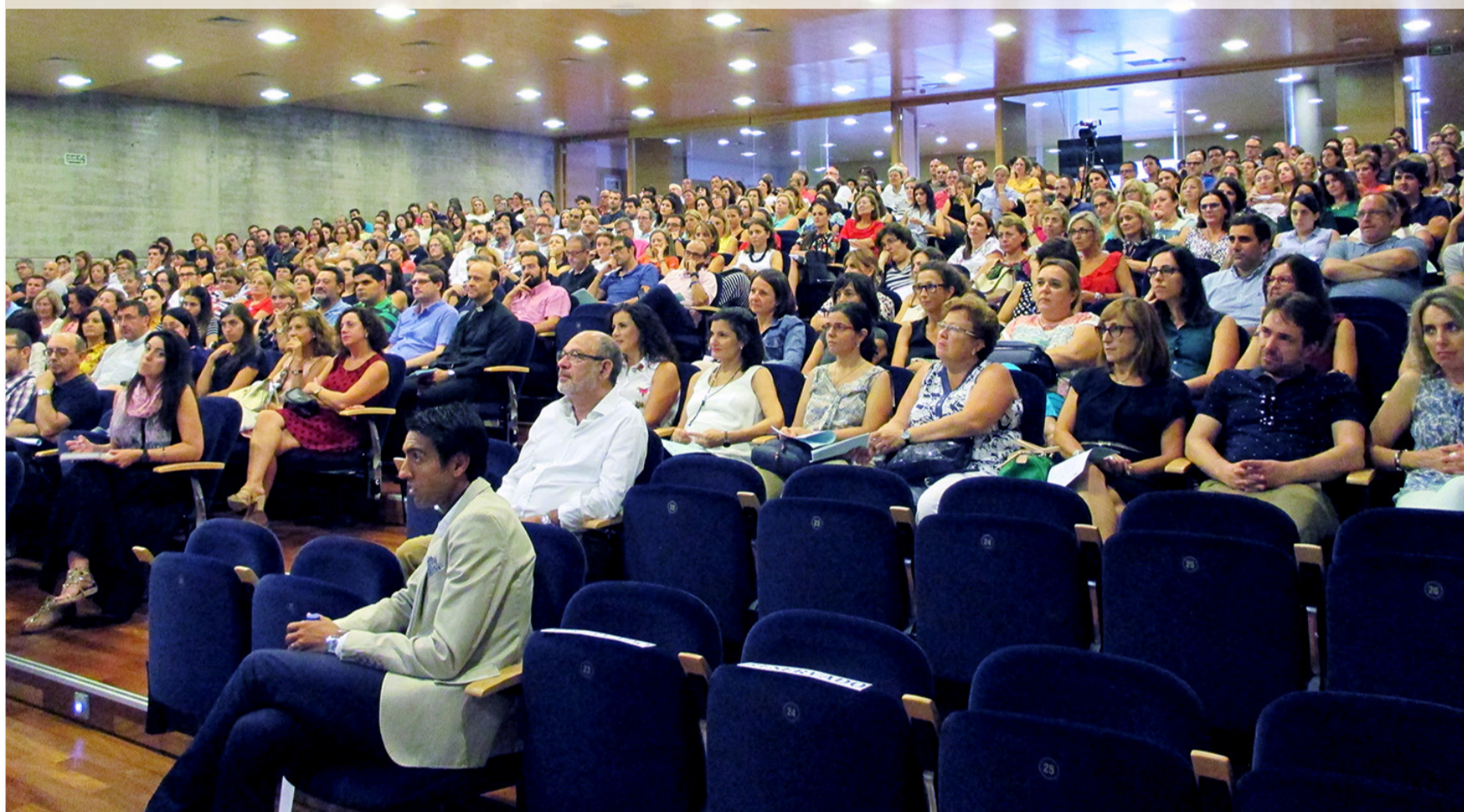
· Vista general del Salón de Actos del Obispado durante la apertura de curso de colegios diocesanos.

· D. Jesús agradece la tarea educativa que está reliazando nuestros colegios y los anima a seguir con esperanza y fe