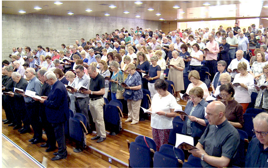
· El Salón de Actos del Obispado durante el Encuentro Diocesano de Pastoral, el junio pasado.

Estos dos itinerarios (formativo y pastoral) se encaminan, en definitiva, a lograr un radio mayor de difusión y de transmisión de la fe en todos los ambientes y lugares: la parroquia, la calle, la familia, el taller, el barrio o el pueblo... A través de ellos