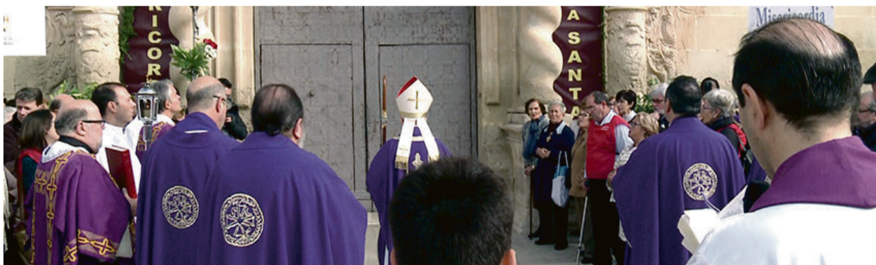
• Imagen de la apertura de la Puerta Santa de la Santa Faz de Alicante

sencias, especialmente en charlas y conferencias en parroquias, colegios diocesanos y asociaciones de fieles, pero también en celebraciones penitenciales y entrevistas personales. Las puertas jubilares de la Diócesis- en la Catedral del Salvador de Orihuela, la Concatedral de San Nicolás de Alicante y el Monasterio de la Santa Faz- y las cinco capillas de la Adoración Perpetua (Orihuela, Alicante, Elche, Elda y Benidorm) han