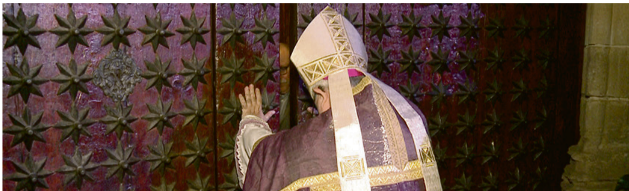
• Imagen de la apertura de la Puerta Santa de la Catedral de Orihuela