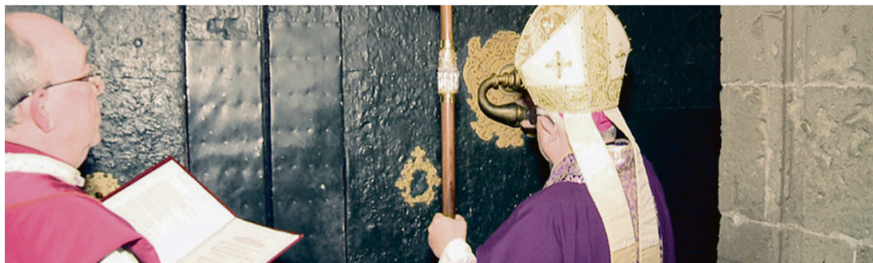
• Imagen de la apertura de la Puerta Santa de la Concatedral de Alicante