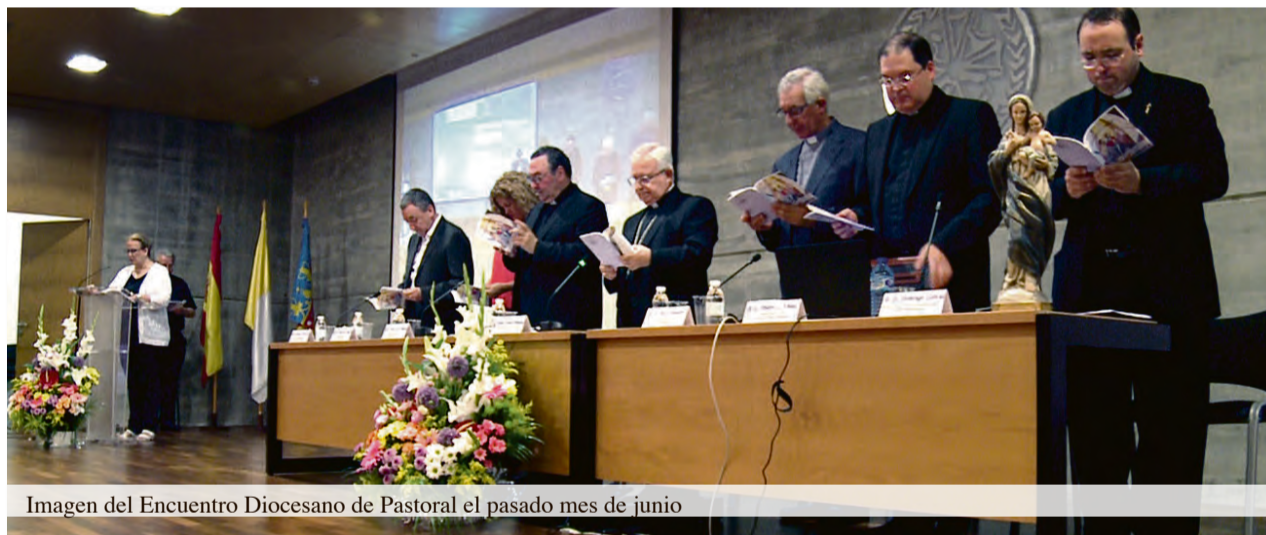
Imagen del Encuentro Diocesano de Pastoral el pasado mes de junio

2) La segunda manera de entender la periferia podría estar más cercana: En todas aquellas personas