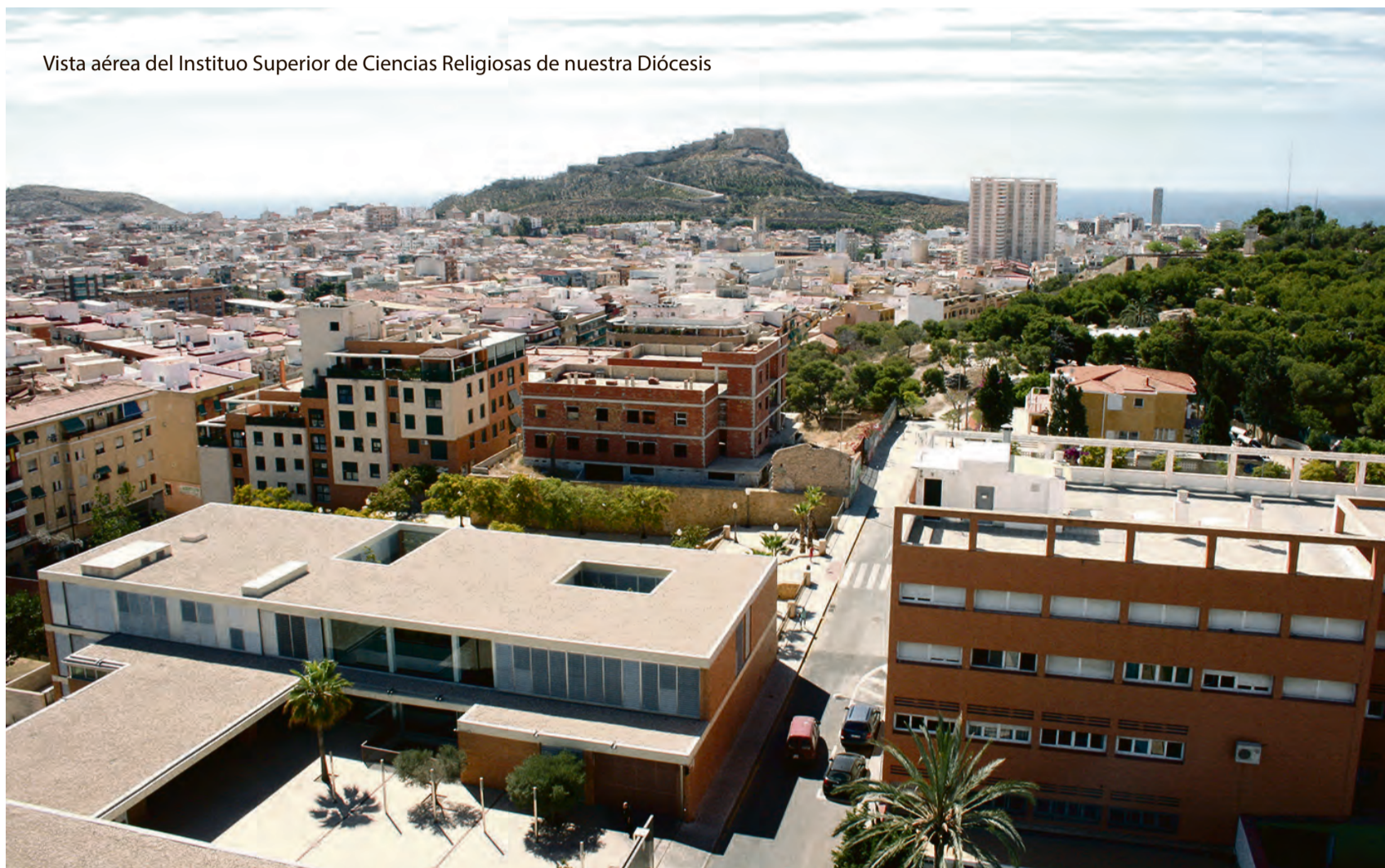
Vista aérea del Instituto Superior de Ciencias Religiosas de nuestra Diócesis