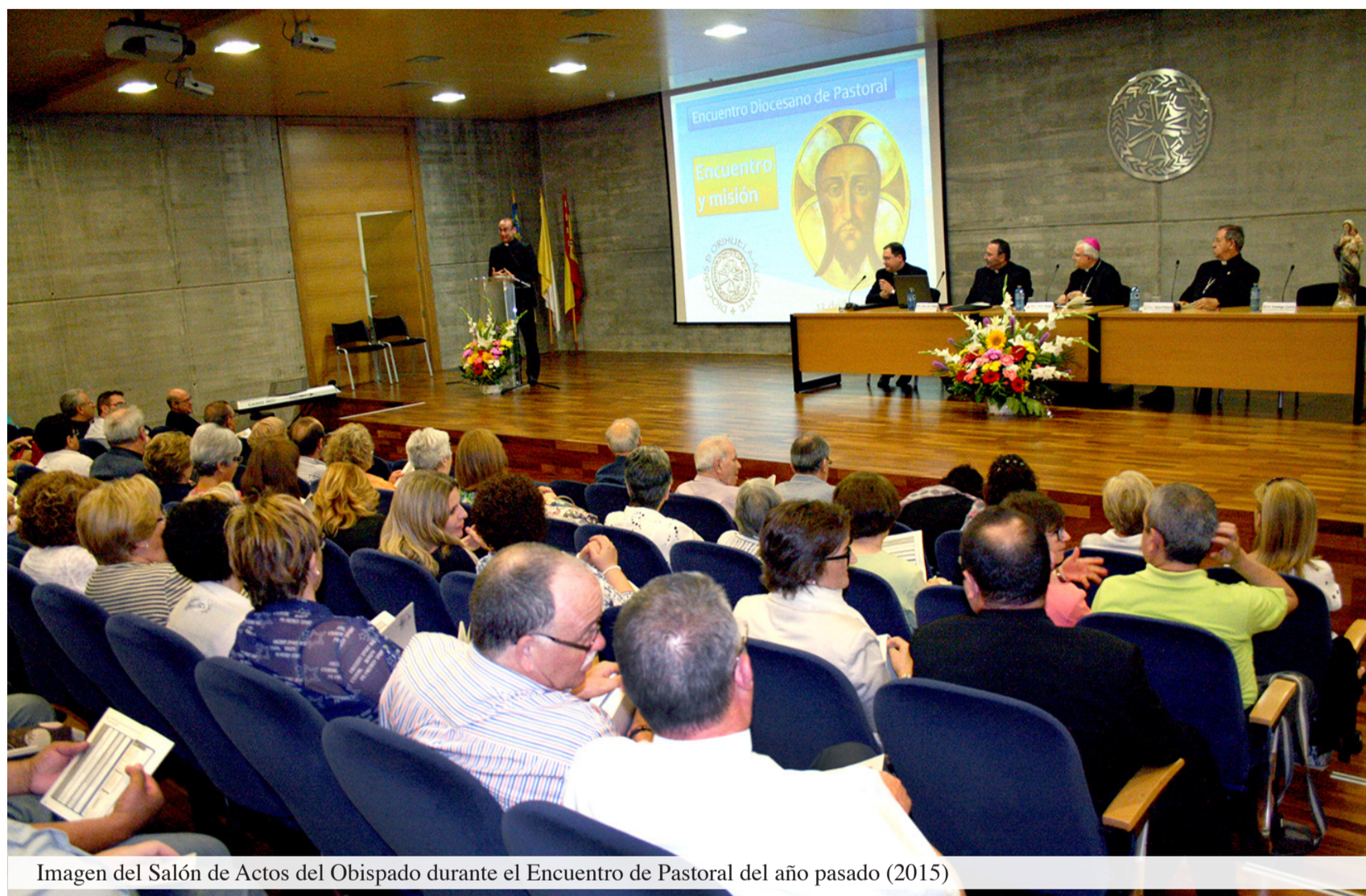
Imagen del Salón de Actos del Obispado durante el Encuentro de Pastoral del año pasado (2015)