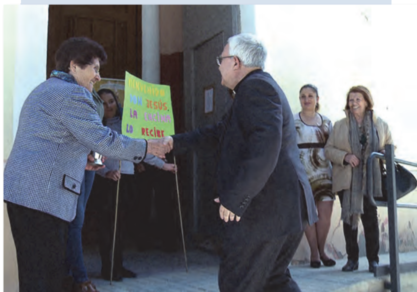
San Juan Bautista, de La Encina: