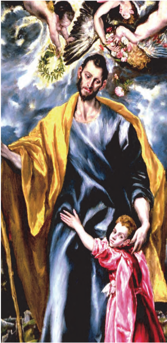
Parroquia Ntra. Sra. de Gracia (Alicante), 19 marzo 2016

memorable fecha, ésta del 19 de marzo. Venimos reuniéndonos hace años en este hermoso templo de Nuestra Señora de Gracia, grande por una parte, pero acogedor por otra, por un doble motivo: - para celebrar anualmente la fiesta de San José, esposo de la Virgen María y padre nutricio de Jesús, nuestro Salvador; y para conmemorar el sexto aniversario de la capilla de adoración perpetua, invitando a nuevos adoradores a unirse a los que ya lo somos.