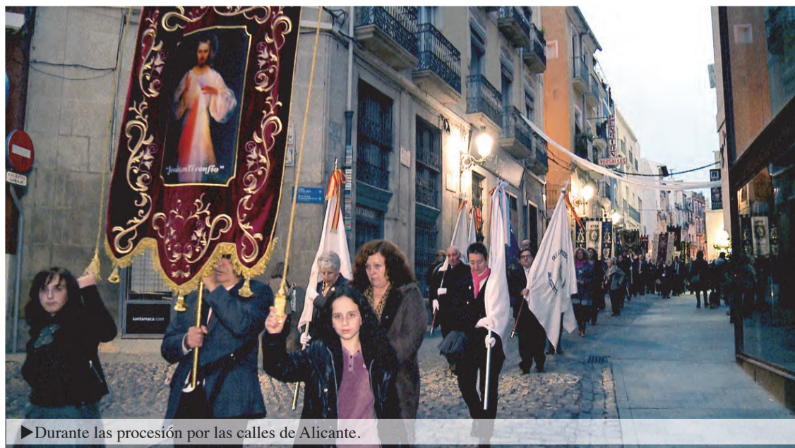
► Durante la procesión por las calles de Alicante.