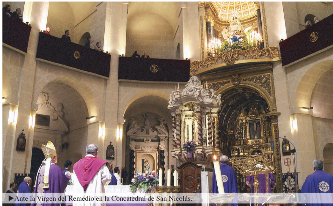
► Ante la Virgen del Remedio en la Concatedral de San Nicolás.

Se abre así un intenso año jubilar en el que se van a potenciar al máximo las obras de misericordia desde todos los ámbitos diocesanos. En esta Diócesis adquiere además un cariz especial al ser el único lugar en la Iglesia donde, desde hace más de 500 años, se venera el Rostro de Jesucristo, la Santa Faz, meta de más de 300.000 peregrinos anuales que tienen como lema: «¡Faz divina! ¡Misericordia!». Alrededor del relicario de la Santa Faz han surgido diversas instituciones de ayuda a los necesitados: Centro para discapacitados adultos «San Rafael», Sanatorio psiquiátrico, Hospital universitario, Instituto Alicantino de la Familia, grupo de pastoral para personas sin hogar... Toda una corriente de misericordia que fluye desde la Santa Faz.