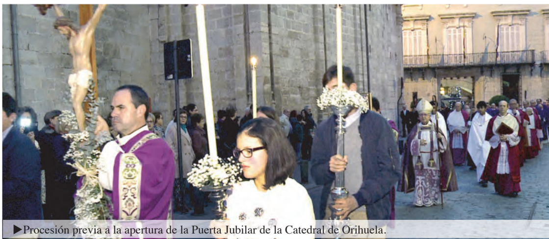
► Procesión previa a la apertura de la Puerta Jubilar de la Catedral de Orihuela.

En esta línea pidió «abrir la mente y el corazón a las nuevas pobrezas». Entre las que destacó la soledad, la desorientación, la angustia, la desesperanza y el sufrimiento en las relaciones familiares,