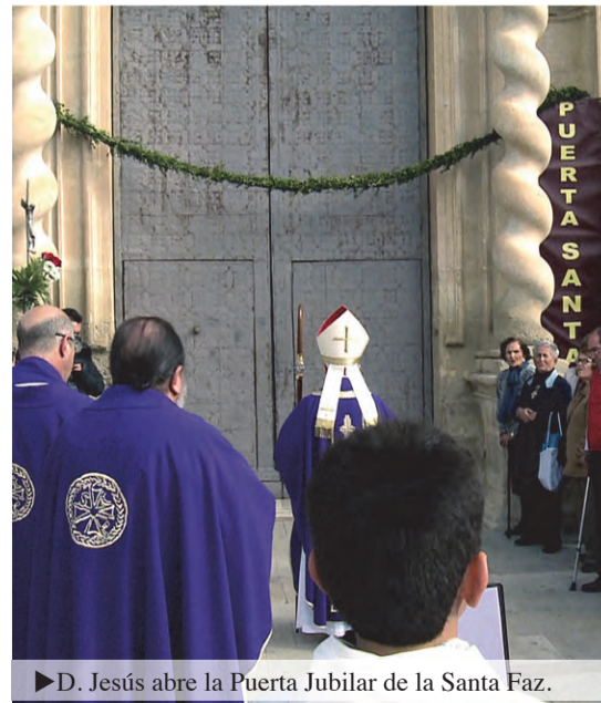
► D. Jesús abre la Puerta Jubilar de la Santa Faz.