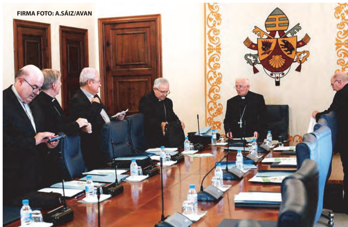
FIRMA

Los obispos de la Provincia Eclesiástica Valentina, integrada por las tres diócesis de la Comunitat Valenciana y las tres de las Islas Baleares, celebraron el pasado 5 de octubre una reunión ordinaria en el Palacio Arzobispal, presidida por el cardenal arzobispo de Valencia, Antonio Cañizares, en la que, entre otros asuntos, han analizado la situación actual de la familia y el matrimonio, con motivo del Sínodo de los Obispos que empezó ayer en el Vaticano, el proceso de nulidades matrimoniales, la religiosidad popular y la iniciación cristiana. Además, los obispos han tratado también