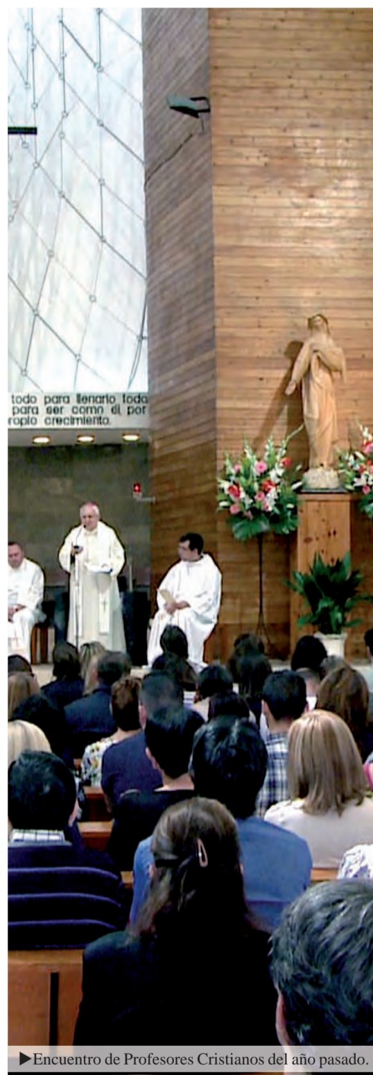
► Encuentro de Profesores Cristianos del año pasado.