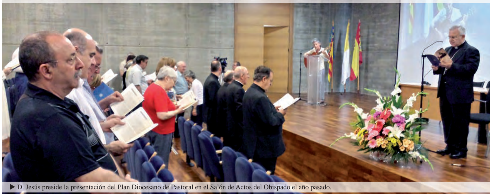
► D. Jesús preside la presentación del Plan Diocesano de Pastoral en el Salón de Actos del Obispado el año pasado.

Cada Iglesia particular, porción de la Iglesia católica bajo la guía de su obispo, también está llamada a la conversión misionera. Ella es el sujeto primario de la evangelización, ya que es la manifestación concreta de la única Iglesia en un lugar del mundo, y en ella «verdaderamente está y obra la Iglesia de Cristo, que es Una, Santa, Católica y Apostólica». Es la Iglesia encarnada en un espacio determinado, provista de todos los medios de salvación dados por Cristo, pero con un rostro local. Su alegría de comunicar a Jesucristo se expresa tanto en su preocupación por anunciarlo en otros lugares más necesitados como en una salida constante hacia las periferias de su propio territorio o hacia los nuevos ámbitos socioculturales. Procura estar siempre allí donde hace más falta la luz y la vida del Resucitado. En orden a que este impulso misionero sea cada vez más intenso, generoso y fecundo, exhorto también a cada Iglesia particular a entrar en un proceso decidido de discernimiento, purificación y reforma. Francisco, EG, 30