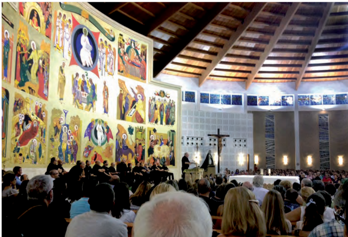
► Dos imágenes del interior de la Parroquia Stma. Trinidad, de S. Pedro del Pinatar, donde se celebró el encuentro.

Palabras pronunciadas por D. José Manuel Lorca Blanes, Obispo de Cartagena, referidas a los presentes del Camino Neocatecumenal, en el encuentro con Jóvenes del Camino celebrado en San Pedro del Pinatar (Murcia) el 28 agosto pasado