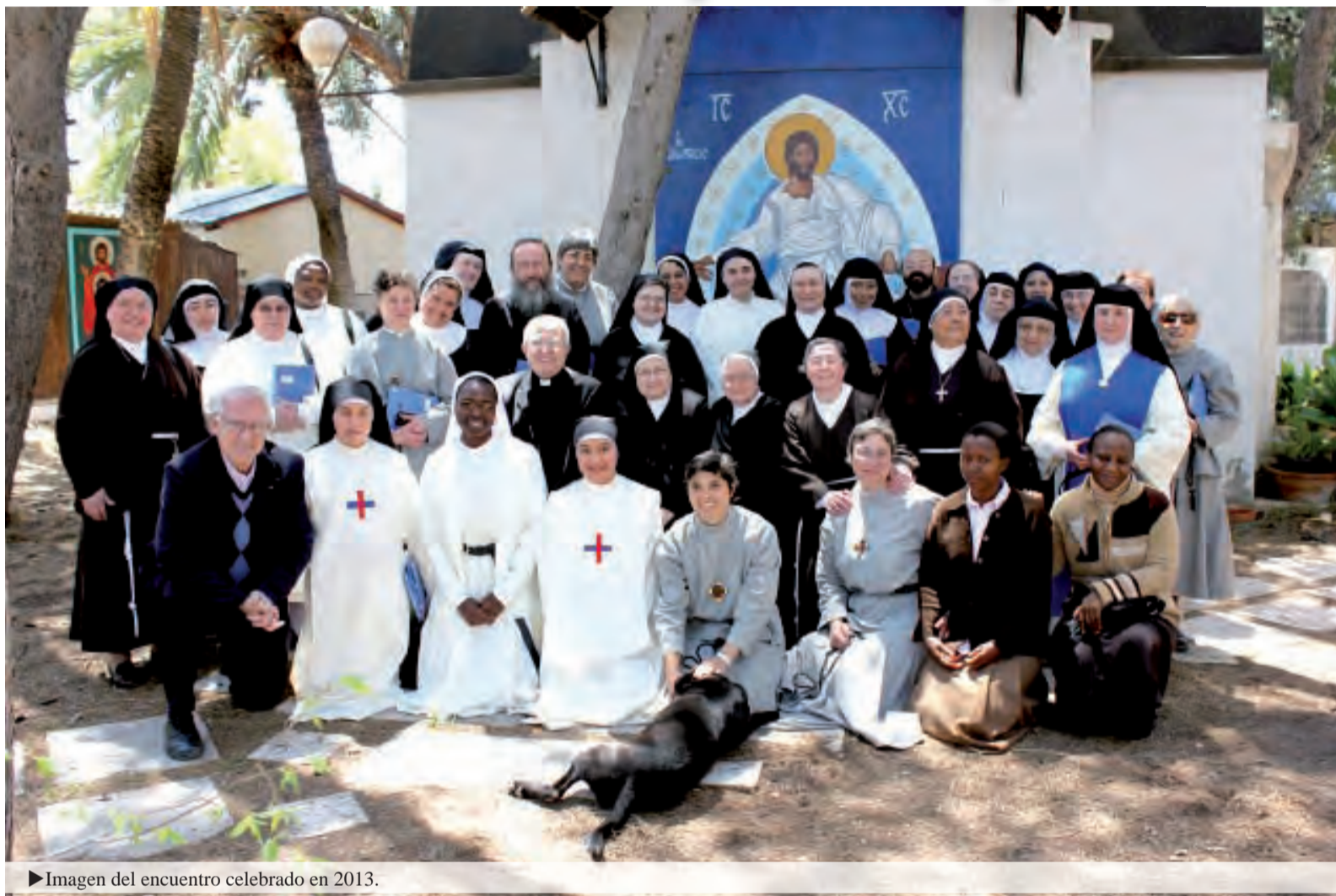
► Imagen del encuentro celebrado en 2013.

El próximo 17 de mayo tendrá lugar en el Monasterio de San Sebastián de Monjas Agustinas de Orihuela las VI Jornadas de Monjas Contemplativas