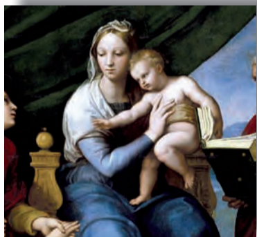
SANTO PADRE FRANCISCO PÁG. 4 La salvación es un regalo