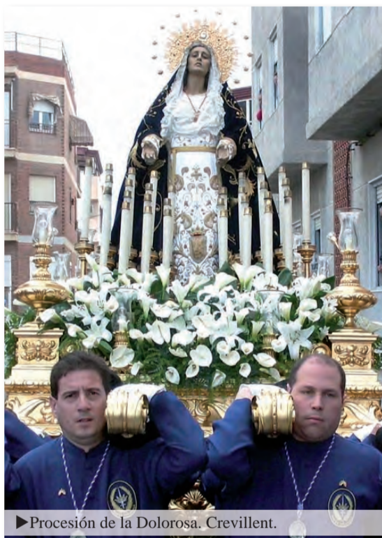
► Procesión de la Dolorosa. Crevillent.