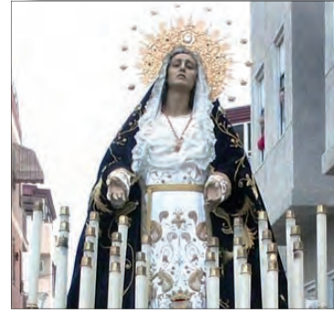
LAICOS PÁG. 13 Cofradías y Hermandades en Semana Santa