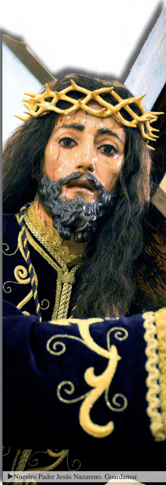
► Nuestro Padre Jesús Nazareno. Guardamar.

Cuando se publique esta edición del NODI estaremos ya a las puertas de la Semana Santa tras una Cuaresma que habrá estado llena de actividades organizadas por Parroquias y Cofradías. En pocos días miles de cofrades saldrán a las calles de nuestra Diócesis a acompañar a las imágenes de su devoción, los ensayos de costaleros y músicos recibirán su premio. Serán muchas las personas que saldrán al encuentro de estos cortejos y nuestras ciudades se inundarán de procesiones. Una periodista que no destaca precisamente por su militancia cristiana definió este fenómeno en España como algo inexplicable sólo con criterios antropológicos (la costumbre, la moda), sólo una causa mayor, que para mí es la Fe lo explica. Otra cosa es que esta Fe necesite estar más meditada. Así mismo esta periodista afirmaba, con razón, que se puede saber lo que cuesta, pero no lo que vale, porque si hubiera que pagar el trabajo voluntario realizado sería imposible sacar a la calle las procesiones. Pues aprovechando el momento voy a reflexionar sobre el motivo que nos lleva a los cofrades a esto. No se trata de hacer una « laudatio » sobre las cofradías, simplemente quiero explicar cuál es