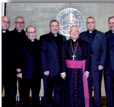
CRÓNICA DIOCESANA PÁG. 7 Toma de posesión del nuevo Consejo Episcopal de la Diócesis