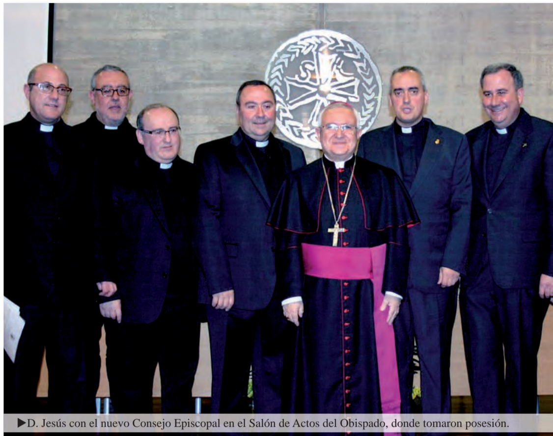
► D. Jesús con el nuevo Consejo Episcopal en el Salón de Actos del Obispado, donde tomaron posesión.

El pasado 20 de marzo tomó posesión al completo el nuevo Consejo Episcopal de la Diócesis de Orihuela-Alicante. Y ha sido ante un salón de actos del Obispado lleno hasta la bandera para recibir al nuevo vicario general y a los renovados vicarios de zona o episcopales. Dichos cargos se hacían públicos por parte del obispo, D. Jesús Murgui, el pasado 6 de febrero, pero no ha sido hasta día 20 de marzo cuando han to-