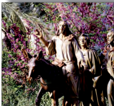
OBISPO DIOCESANO PÁG. 3 «Tanto amó Dios al mundo que entregó a su Hijo único» (Jn 3,16)