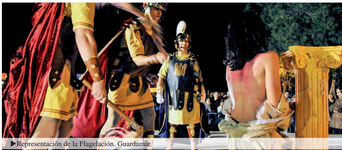
► Representación de la Flagelación. Guardamar.

Gracias a las cofradías llega a la calle esta noticia y muchas personas, al menos una vez al año, sienten la llamada de Jesús. Nuestro mayor deseo sería que sirviera para que se implicaran en la vida parroquial y que todos supiéramos manifestar en nuestra vida diaria la fe en Dios