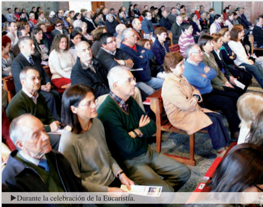
► Durante la celebración de la Eucaristía.