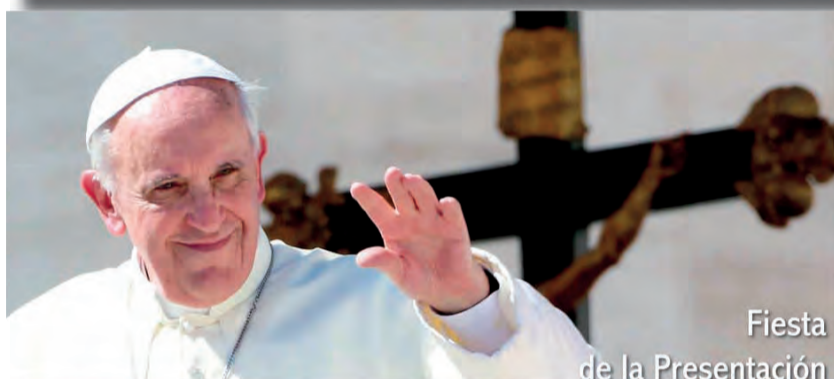
Fiesta de la Presentación del Señor