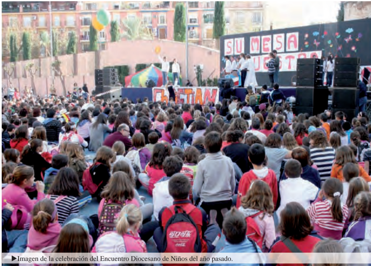
► Imagen de la celebración del Encuentro Diocesano de Niños del año pasado.

En este sentido, es correcto afirmar que la auto-evangelización de la Iglesia tiene que preceder a la nueva evangelización del mundo. Por ello, la Iglesia, en los últimos decenios, ha utilizado tanto el término «evangelización», que aunque está poco presente en los documentos del Vaticano II, ha experimentado desde el pos concilio una verdadera explosión de actualidad, sobre todo a raíz del Sínodo de obispos de 1974 y del documento de Pablo VI Evangelii Nuntinandi de 1975, carta magna de la evangelización de la Iglesia en el mundo contemporáneo. Así lo declaraba Pablo VI: «Con gran gozo y consuelo hemos escuchado Nos, al final de la Asamblea de octubre de 1974, estas palabras luminosas: ‘Nosotros queremos confirmar, una vez más, que la tarea de la evangelización de todos los hombres constituye la misión esencial de la Iglesia’: una tarea y misión que los cambios amplios y profundos de la