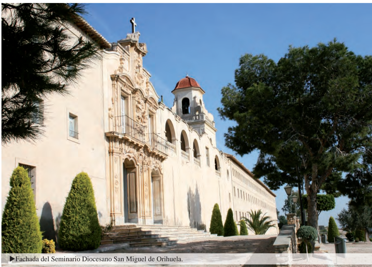
► Fachada del Seminario Diocesano San Miguel de Orihuela.