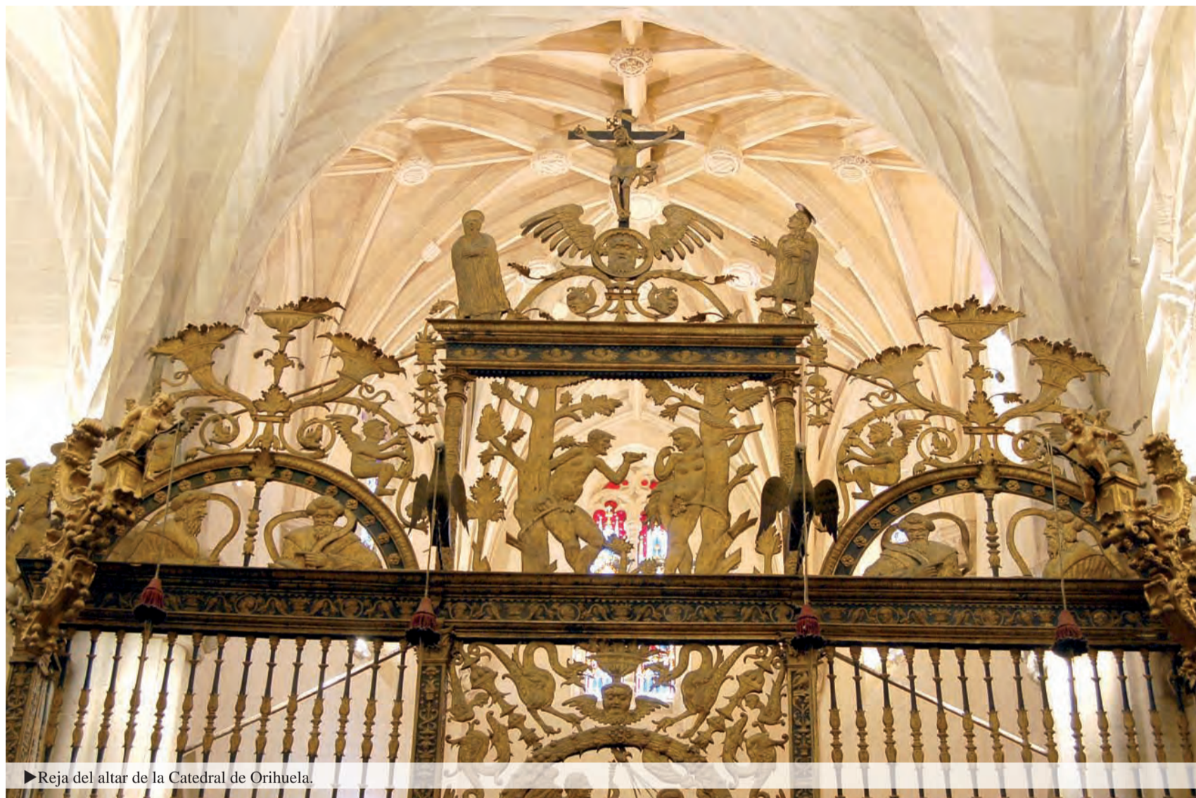
► Reja del altar de la Catedral de Orihuela.