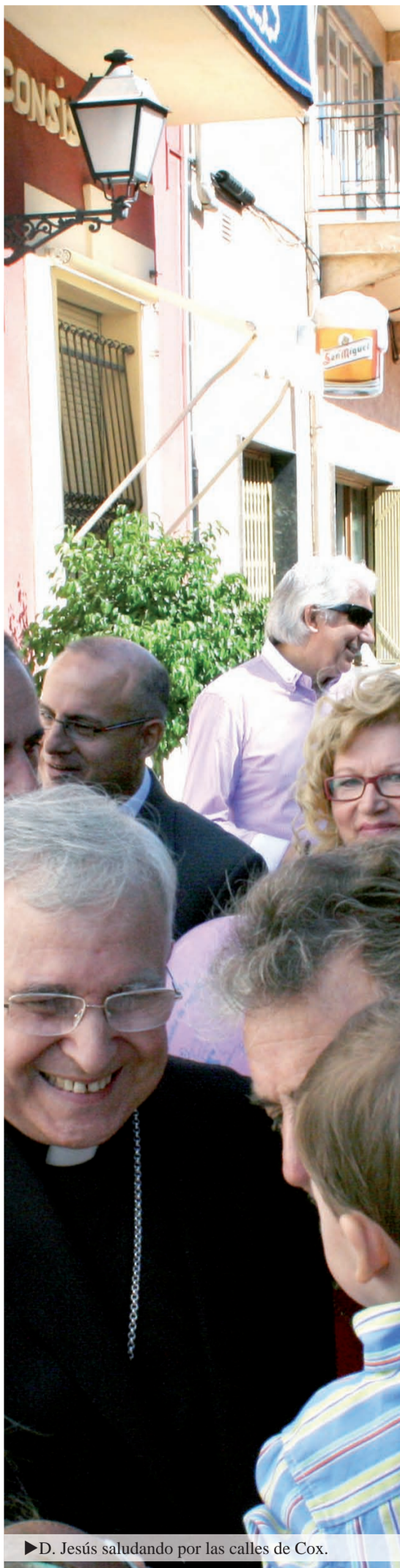
► D. Jesús saludando por las calles de Cox.

✠ Jesús Murgui Soriano Obispo de Orihuela-Alicante