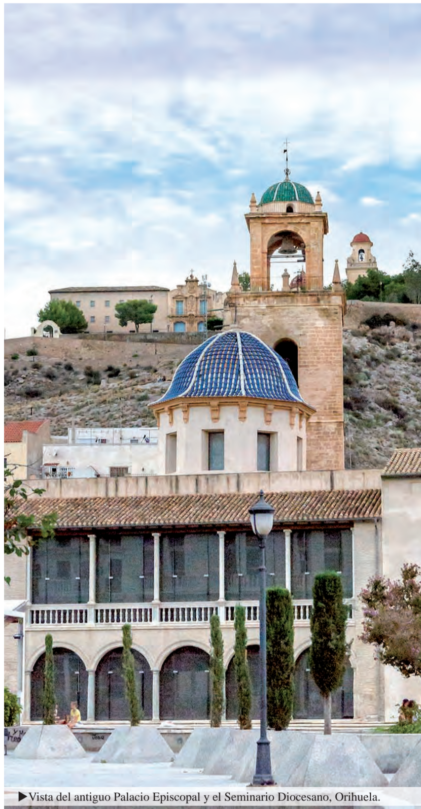
► Vista del antiguo Palacio Episcopal y el Seminario Diocesano, Orihuela.

El primer sínodo de la diócesis de Orihuela va unido a la persona del que fue su primer obispo, el burgalés D. Gregorio Antonio Gallo, profesor de la universidad de Salamanca y canónigo magistral de su catedral. En la diócesis recién fundada había que afrontar varios problemas graves: pacificar, evangelizar y reorganizar eclesiásticamente un territorio que había sufrido las consecuencias de un conflicto continuado con el obispado de Cartagena, crear las estructuras de la nueva diócesis, afrontar con éxito la formación cristiana de los conversos musulmanes y aplicar con profundidad los acuerdos del concilio de Trento. Todo este trabajo se debía hacer en estrecha unidad con la diócesis de Valencia, de la que Orihuela era sufragánea. El obispo Gallo afrontó con decisión y tesón estos proyectos y para ello se sirvió del sínodo diocesano de 1569, el primero celebrado en la diócesis. En él se indicaron las tareas de los párrocos, especialmente su responsabilidad por la catequesis y la evangelización, su forma de vivir y de vestir, el cuidado de las ceremonias litúrgicas, el cumplimiento