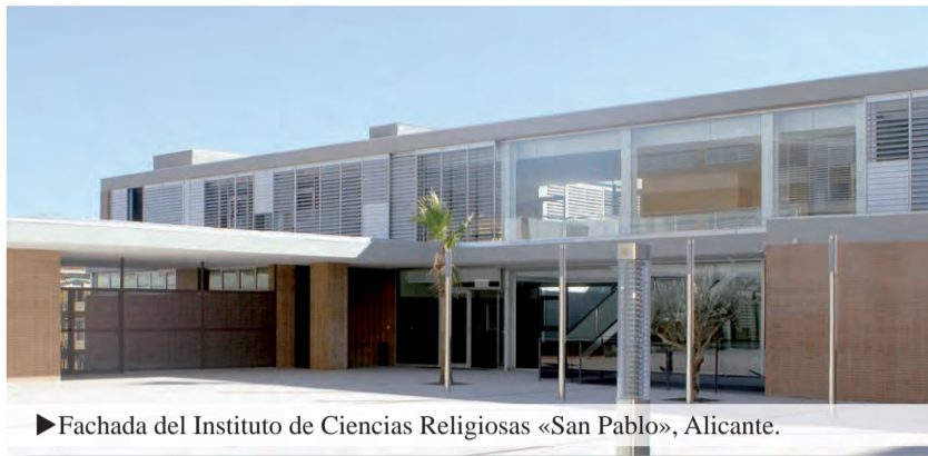
► Fachada del Instituto de Ciencias Religiosas «San Pablo», Alicante.