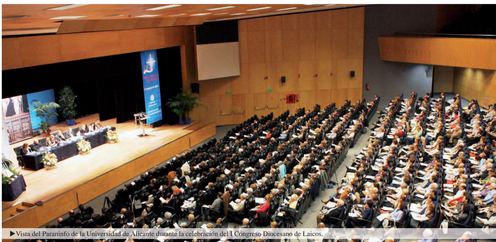
► Vista del Paraninfo de la Universidad de Alicante durante la celebración del I Congreso Diocesano de Laicos.

En estos 450 años de historia, nuestra Diócesis de Orihuela-Alicante no ha recorrido otro camino que el de la Evangelización. Podemos decir que gracias a su presencia y a su trabajo, el Evangelio ha penetrado y ha dado sus frutos en nuestra tierra. La evangelización no es una tarea más de la Iglesia de la que se pueda prescindir, sino la tarea por excelencia que nunca puede faltar. Conocer y amar a nuestra Diócesis es conocer y amar la tarea fundamental para la cual nació: la evangelización. Dedicamos, pues, este tema a profundizar la evangelización, puesto que define el ser y el hacer de la Iglesia. Tratemos de extraer enseñanzas y conclusiones para el momento presente de nuestra vida diocesana