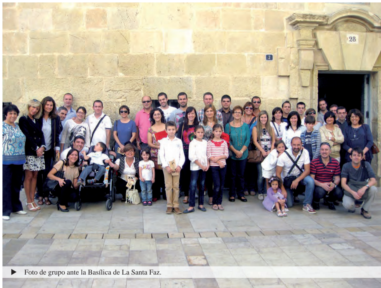
► Foto de grupo ante la Basílica de La Santa Faz.

El pasado 26 de octubre, los profesores de Religión de la Diócesis tuvimos la convivencia de inicio de curso en Santa Faz-Alicante donde más de medio centenar de docentes visitaron la Basílica de Santa Faz con motivo del año jubilar. Dicha convivencia es la segunda parte de nuestra especial celebración del año de la Fe, ya que el año pasado esta misma actividad se hizo visitando la Catedral de Orihuela.