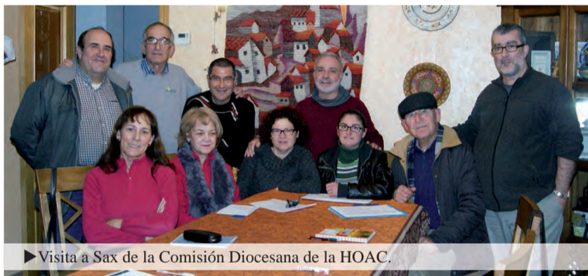
► Visita a Sax de la Comisión Diocesana de la HOAC.

... evangelizar implica situarnos cerca de los empobrecidos del mundo obrero, testimoniar con nuestra manera de vivir que una nueva vida de comunión merece la pena