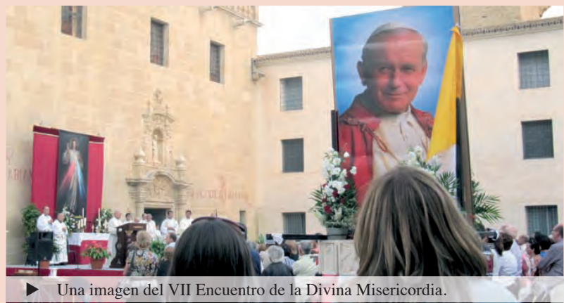
► Una imagen del VII Encuentro de la Divina Misericordia.

España responde al VII Encuentro de la Divina Misericordia en el Monasterio de la Santa Faz y la Concatedral de San Nicolás, en la Ciudad de Alicante. Antes y después de cada acto religioso programado, ciudadanos venidos de toda España, se acercaron a la mesa de Derecho a Vivir (HazteOir.org), donde firmaron masivamente las Iniciativas One of Us (Uno de Nosotros) y Aborto 0. Los niños también querían firmar, pero se conformaron apoyando la causa con sus imágenes y carteles. De nuevo se acercaron ciudadanos, ingleses, alemanes y otros países latinoamericanos, a los que indicamos la forma de firmar a través de Internet. Gracias al Obispado de Orihuela-Alicante, a la organización del Encuentro y a todos los asistentes. Sí a la Vida.