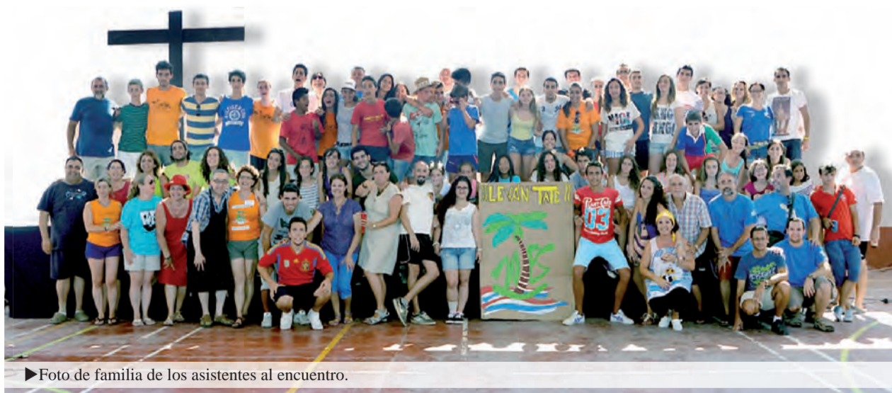
► Foto de familia de los asistentes al encuentro.

Con el lema «Levántate» el Colegio San José Obrero de Orihuela, se convirtió durante unos días de Agosto en casa para 450 jóvenes Misioneros de la Espe-