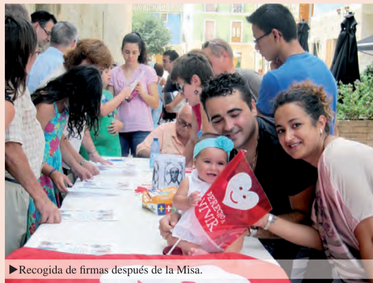
► Recogida de firmas después de la Misa.

A pesar de los calores, a las 12 del mediodía del domingo 28, y, como es costumbre todos los últimos domingos de mes, decenas de familias alicantinas y de otros puntos de España y el mundo, con sus bebés, enfermos y mayores, además de mamás embarazadas, peregrinaron a La Santísima Faz para recibir la Bendición Especial ante la Imagen y recoger la Primera Entrega de Bendiciones Apostólicas del Papa Francisco, coincidiendo con el año Jubilar e Indulgencia Plenaria en el Monasterio. Así veía la luz la primera remesa de documentos sacros que correspondían a la peregrinación a La Santa Faz del mes de abril. También se recogieron firmas para la comunidad europea de la iniciativa Uno de Nosotros, para la Defensa del Em-