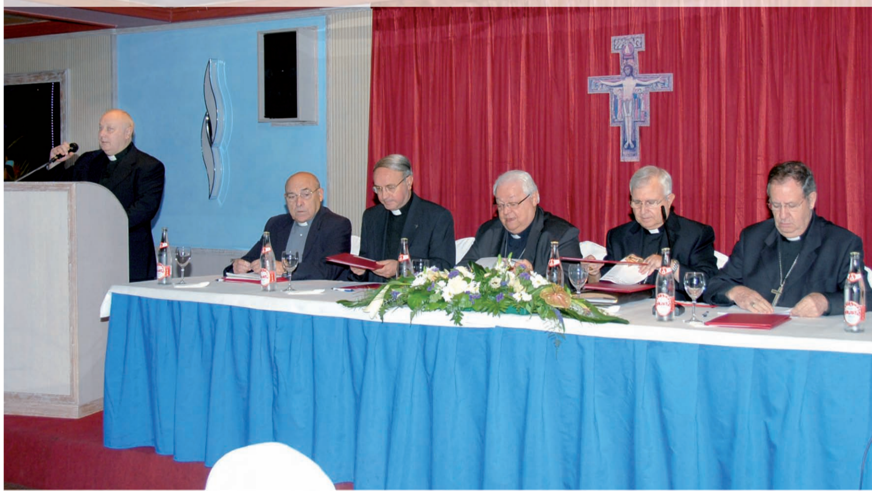
► Jornadas Nacionales de Turismo celebradas en Benidorm en 2012.