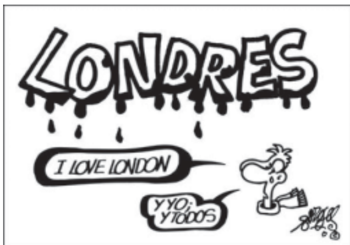
Forges en El País