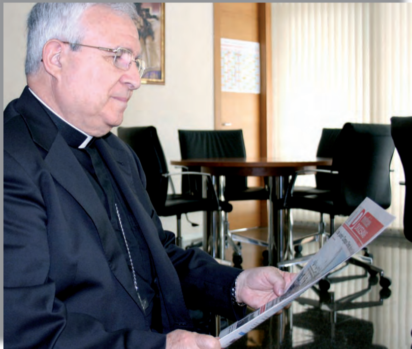
►D. Jesús echa un vistazo a nuestra publicación “Noticias Diocesanas”.

14. Llega por tanto el ansiado descanso para muchos ¿Descansa un Obispo en verano? Yo siempre he aprovechado los veranos para preparar los escritos pastorales del curso, es decir, para todo el trabajo más intenso de lectura, de estudio y de escritura que durante el año no puedo hacer. Este verano quizá sea distinto porque hay bastantes salidas organizadas desde la Diócesis: Lourdes, la peregrinación de jóvenes a Santiago, Tierra Santa, peregrinación de catequistas y de las familias a Roma. Sin olvidar tampoco las fiestas de obligada presencia. Pero no olvidemos que para la gente de estas tierras las fiestas son vida, son convivencia y aire para seguir caminando, y yo me siento muy de aquí; gracias a Dios y a vosotros.