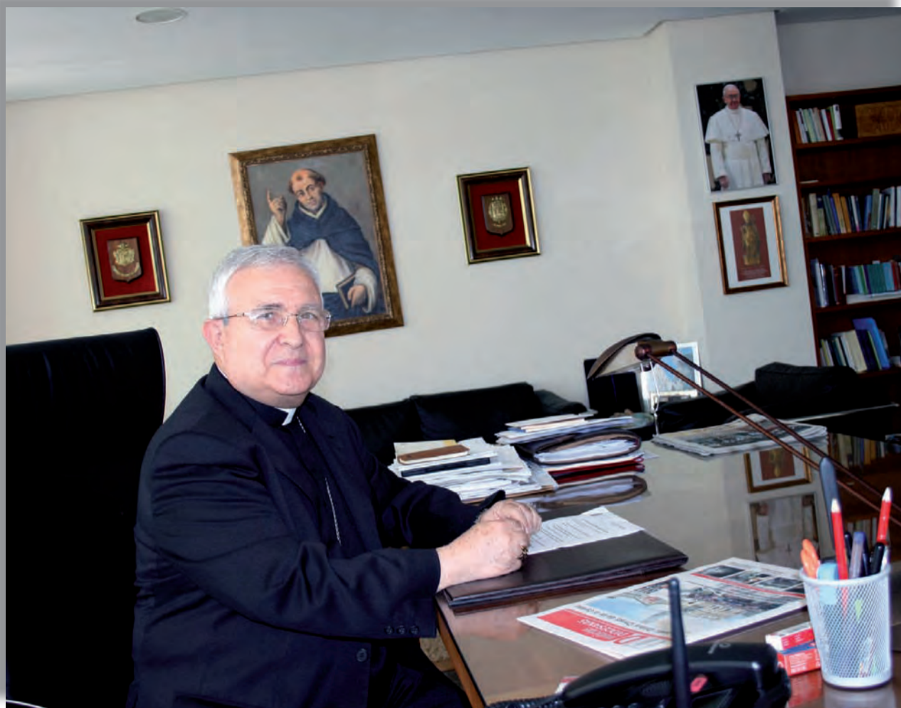
► D. Jesús nos atiende amablemente en su despacho.

«Debemos despertar, todavía más, el espíritu misionero de todas las comunidades de nuestra Diócesis»