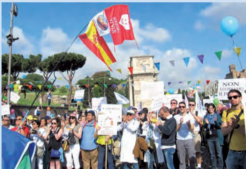
► Imagen de un momento de la III Marcha Nacional por la Vida de Roma.

✓ Magníficas ponencias y testimonios en los trabajos previos a la Marcha, celebrados la víspera en el Ateneo Regina Apostolorum