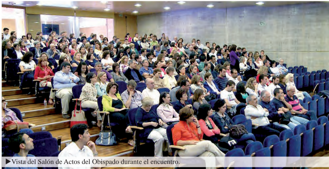
► Vista del Salón de Actos del Obispado durante el encuentro.

Finalmente, en sus pistas para superar la emergencia educativa, propuestas en su Carta a la Diócesis de Roma de 2008, considera que «la educación no puede prescindir del prestigio, que hace creíble el ejercicio de la autoridad. Que es fruto de la experiencia y de la competencia, pero que se adquiere, sobre todo, con la coherencia de la propia vida y la implicación personal, expresión del amor verdadero. Por tanto el educador es un testigo de la verdad y del bien; ciertamente también es frágil y puede tener errores y caídas, pero tratará siempre de ponerse en sintonía de nuevo con su misión».