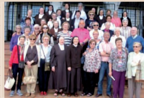
► Participantes en la convivencia CONFER.

Puntualmente, a las 9:00 h salía el autobús desde Alicante con un total de 31 participantes. Según programa, se pasó la mañana visitando Calpe y el Peñón de Ifach. Un paseo matinal, en una mañana espléndida, que invitaba a explicar la mirada ante la perspectiva de un mar en calma, de un puerto y de una ciudad que despertaba. Admiramos las bellezas de la naturaleza y alguno incluso, recordando tiempos pasados de dileta nte montañero, las alturas del Peñón. Pero, decidimos sólo contemplarlo, inhiesto en su sitio, como símbo-