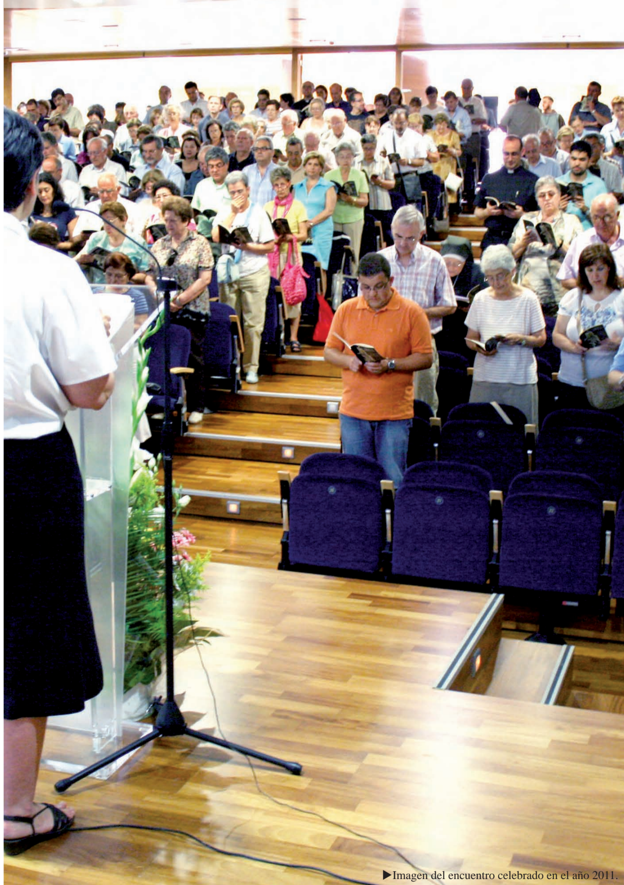
► Imagen del encuentro celebrado en el año 2011.