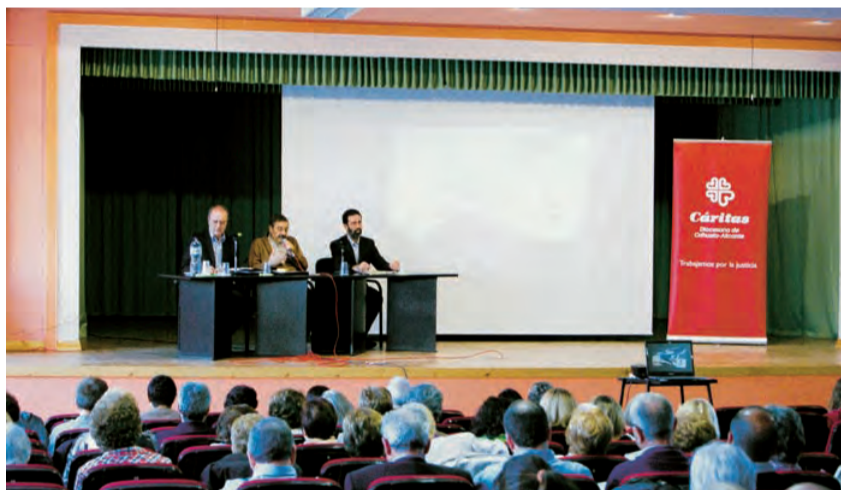
► XIII Escuela Diocesana de Cáritas.

siendo cada vez más extensa, más intensa y más crónica, con el riesgo de convertirse en estructural. Desde Cáritas, con conciencia social cristiana, con amor sin límite y con el carisma de pertenencia eclesial, tratamos de construir sociedad, desde los principios de solidaridad, fraternidad, entrega y gratuidad. Señalar los inconvenientes de los importantes desequilibrios financieros provocados por el fuerte incremento de personas atendidas y la disminución de ingresos, especialmente aquellos provenientes de la Administración, para el apoyo a nuestros programas de promoción y desarrollo de las