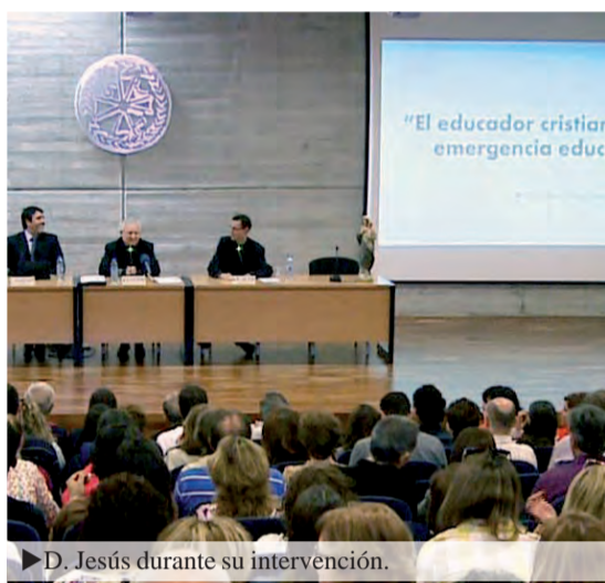
► D. Jesús durante su intervención.

Queridos participantes en el XVII Encuentro Diocesano de Educadores Cristianos: