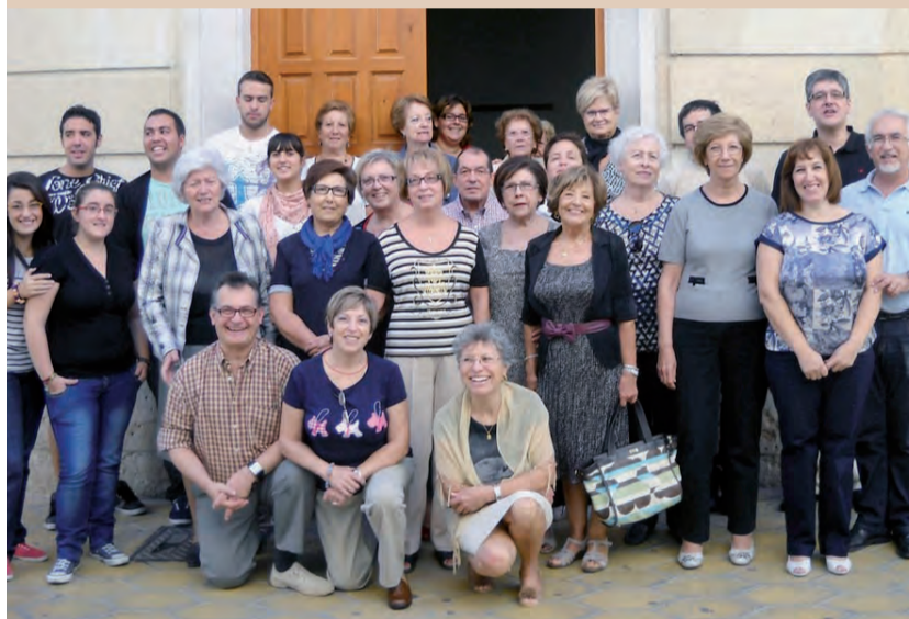
► Miembros de la Asamblea de Acción Católica General.

Pensando en una nueva evangelización, Juan Pablo II presentaba en la Exhortación Apostólica Christifideles Laici la asociación de los fieles y la formación de los mismos como dos palancas capitales para evangelizar (ChL 29-31 y 57-63). El Papa propone la formación en consonancia con la llamada a crecer, a madurar continuamente, a dar siempre más fruto. La formación nos ayudará a no tener dos vidas paralelas, nos ayudará unificar fe y vida. Respecto de la llamada a asociarnos como cristianos, el Papa nos recuerda dos razones claras: una de tipo antropológico y social, y más allá de estos motivos, la razón profunda que justifica y exige la asociación de los fieles laicos es de orden teológico, es una razón eclesiológica, como abiertamente reconoce el Concilio Vaticano II cuando ve en el apostolado asociado un «signo de comunión y de la unidad de la Iglesia de Cristo» (AA, 18).