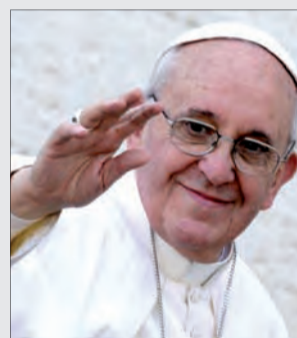
SANTO PADRE FRANCISCO PÁG. 3

«Los cristianos no hemos sido elegidos por el Señor para pequeñeces»