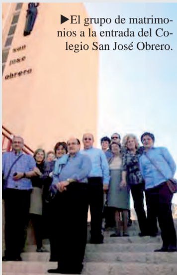
► El grupo de matrimonios a la entrada del Colegio San José Obrero.