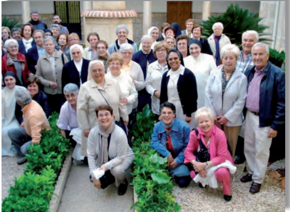
► CONFER con las dominicas.

Fue uno de los buenos momentos de conviven-