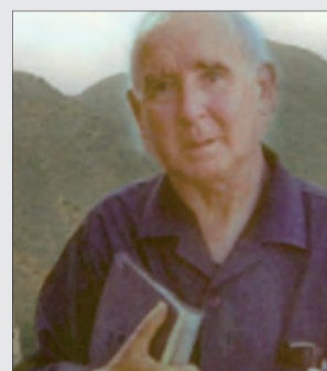
TESTIGOS DE LA FE EN LA DIÓCESIS PÁG. 4

«Los cristianos no hemos sido elegidos por el Señor para pequeñeces»