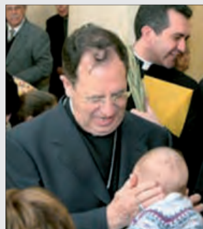
CRÓNICA DIOCESANA PÁG. 6