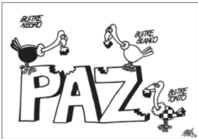
Forges en El País