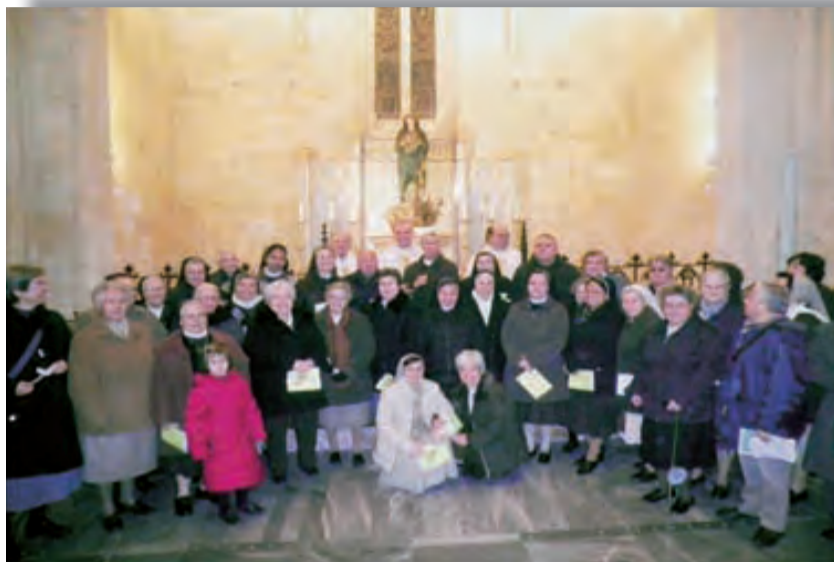
► Grupo de asistentes en la Catedral.