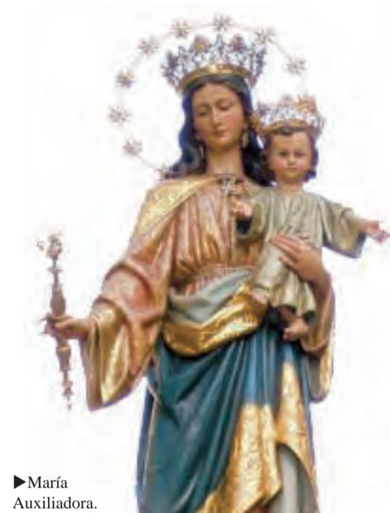
► María Auxiliadora.

Lo nuestro es la educación y promoción humana de la infancia y juventud, hecha de afecto y de responsabilidad, capaz de acoger, proteger y al mismo tiempo hacer crecer y enseñar a afrontar