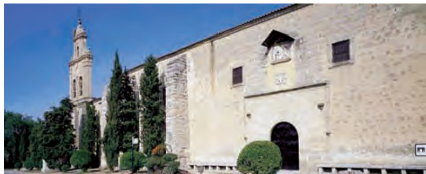
► Monasterio de La Encarnación de Ávila.

amor a la verdad; la determinación como fruto de la audacia cristiana; la esperanza teologal, que describe como sed de agua viva. Sin olvidar las virtudes humanas: afabilidad, veracidad, modestia, amabilidad, alegría, cultura. En segundo lugar, santa Teresa propone una profunda sintonía con los grandes personajes bíblicos y la escucha viva de la Palabra de Dios. Ella se siente en consonancia sobre todo con la esposa del Cantar de los cantares y con el apóstol san Pablo, además del Cristo de la Pasión y del Jesús eucarístico.