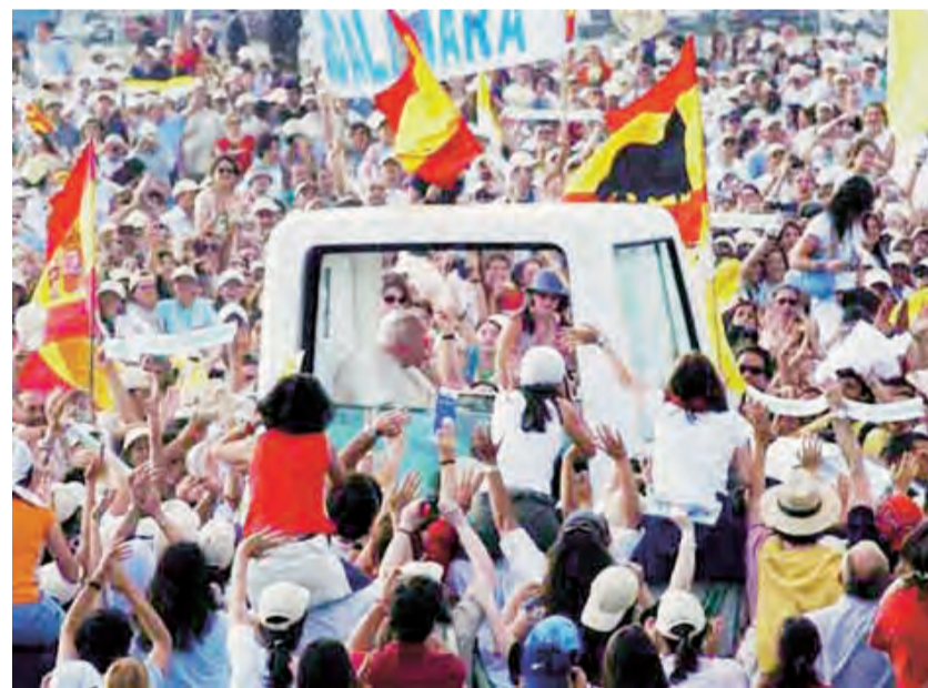
► Juan Pablo II recorre Tor Vergata aclamado por los jóvenes en la JMJ de Roma 2000.

generación de finales de los sesenta, con sus propias peculiaridades, vino y se fue. Incluso la siguiente generación, más pragmática, ha envejecido. Hoy en día, hay que preguntarse: «¿Cómo podemos hacer frente a un mundo que se pone en peligro, y en el que el progreso se convierte en un peligro? ¿No deberíamos empezar todo de nuevo desde Dios?» (Luz del Mundo). Así que Benedicto XVI hace un llamamiento «a que pueda surgir una nueva generación de católicos, personas renovadas interiormente, que se comprometan en la política sin ningún complejo de inferioridad» (una idea muchas veces repetida por el Papa, por ejemplo, en el Mensaje para la 46ª Semana Social de los católicos italianos, 12 de octubre de 2010). Él sigue pidiendo una nueva generación de buenos intelectuales y cien-