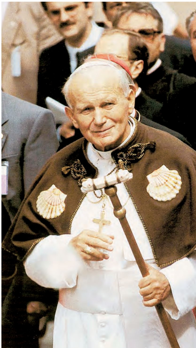
► Juan Pablo II viaja en 1989 a Santiago de Compostela y encontrarse con los jóvenes.