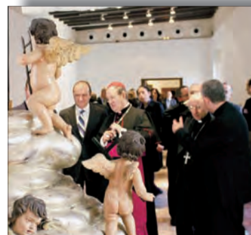
REPORTAJE PÁGS. 12-13 Inaugurado el Museo Diocesano de Arte Sacro de Orihuela