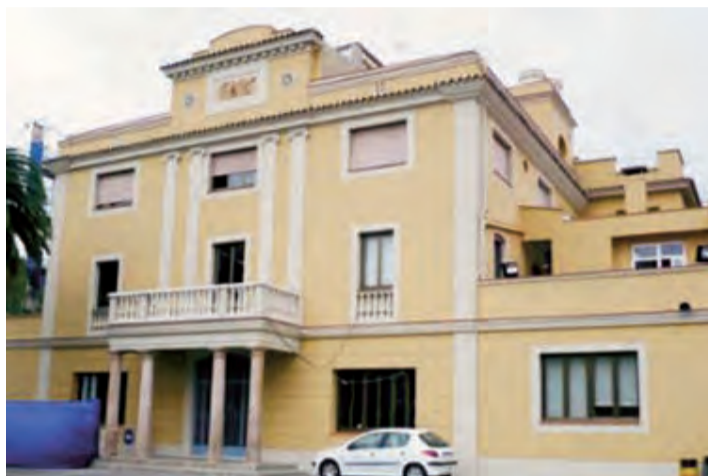
► Año 1886. Torre Gironella (Barcelona) «Aquí vendrán las Hijas de María Auxiliadora» Don Bosco.