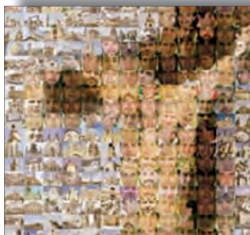
CARTA DEL OBISPO PÁG. 5 El sacerdote, don de Dios para el mundo. Día del Seminario 2011