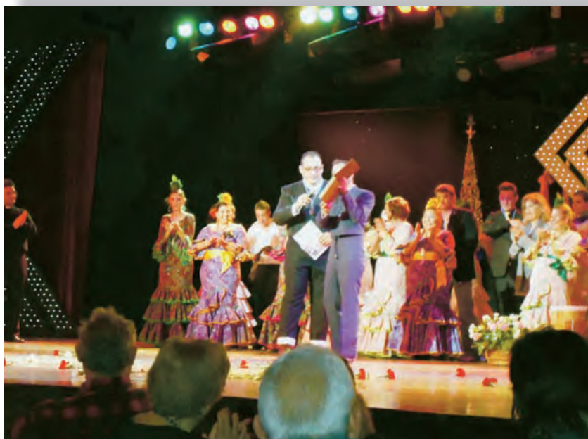
►Parte de la Hermandad del Rocío sobre el escenario.

El domingo día 13 de febrero el Benidorm Palace llenó por completo su aforo por una buena causa, recoger dinero para las personas y familias más necesitadas de Benidorm. El éxito fue posible gracias a la Hermandad del Rocío de la Parroquia de Nuestra Señora de la Almudena que con el lema « Música y danza por alimentos » presentaron su primer disco. Gracias a este gesto de solidaridad muchas personas y familias que Cáritas acoge, atiende y ayuda podrán seguir beneficiándose de ese amor que la Iglesia reparte de muchas formas distintas. Durante la Gala se proyectó un video elaborado por Radio/Televisión Sirena de Benidorm en donde los voluntarios y voluntarias, las personas beneficiadas, la animadora/coordinadora de la zona y sacerdotes implicados en Cáritas, hablaron de la labor e identidad de la misma, con el fin de que las personas que allí se encontraban conocieran qué es y qué hace Cáritas con las personas que llaman