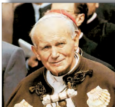
IGLESIA EN EL MUNDO PÁG. 4 ¡Estamos felices! (IV Parte) Juan Pablo II y la JMJ