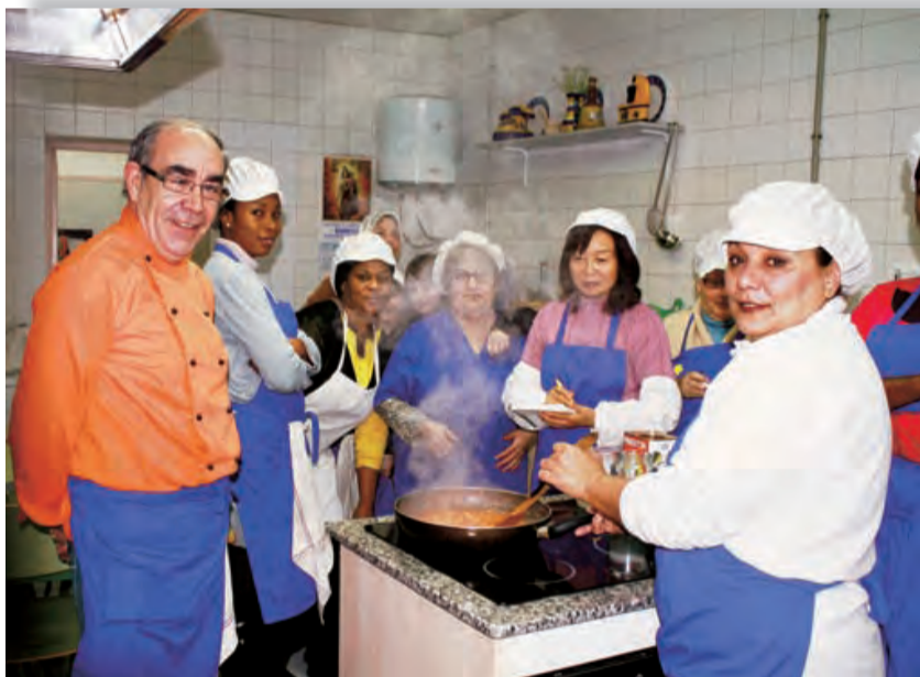
►Participantes en el taller de cocina.

Diariamente se acercan más de una treintena de personas en busca de ayuda; y a veces nos parece que lo que hemos logrado es solo una gota en el océano, pero inmediatamente nos damos cuenta que sin ella el océano estaría incompleto. Para los voluntarios que colaboramos en Caritas, lo más importante no es lo que damos, sino el amor con que lo hacemos. Tenemos la misión de atender a todo aquel que lo necesite y trabajar por la construcción de una sociedad más justa y fraterna.