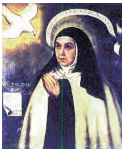
► Santa Teresa de Jesús.

No es fácil resumir en pocas palabras la profunda y articulada espiritualidad teresiana. Quiero mencionar algunos puntos esenciales. En primer lugar, santa Teresa propone las virtudes evangélicas como base de toda la vida cristiana y humana: en particular, el desapego de los bienes o pobreza evangélica, y esto nos ata a todos; el amor mutuo como elemento esencial de la vida comunitaria y social; la humildad como