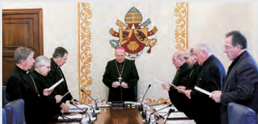
► Los obispos durante la reunión.

Los obispos de la Provincia Eclesiástica Valentina, integrada por las diócesis de la Comunitat Valenciana y de las islas Baleares, han estudiado hoy impulsar «el sentido eclesial de la acción de Cáritas» en sus respectivas diócesis. En una reunión que ha presidido el arzobispo de Valencia, monseñor Carlos Osoro, el 14 de febrero, los preladados han abordado «cuestiones de todo tipo relativas a la vida diaria de las diócesis y su coordinación como provincia eclesial, que es una unidad que queremos potenciar». De entre todos los asuntos abordados, los obispos priorizaron tres: el impulso del sentido de Iglesia en la acción de Cáritas, la pastoral vocacional y los preparativos para la Jornada Mundial de la Juventud