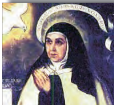
BENEDICTO XVI PÁG. 3 Santa Teresa de Jesús, una de las cimas de la espiritualidad cristiana