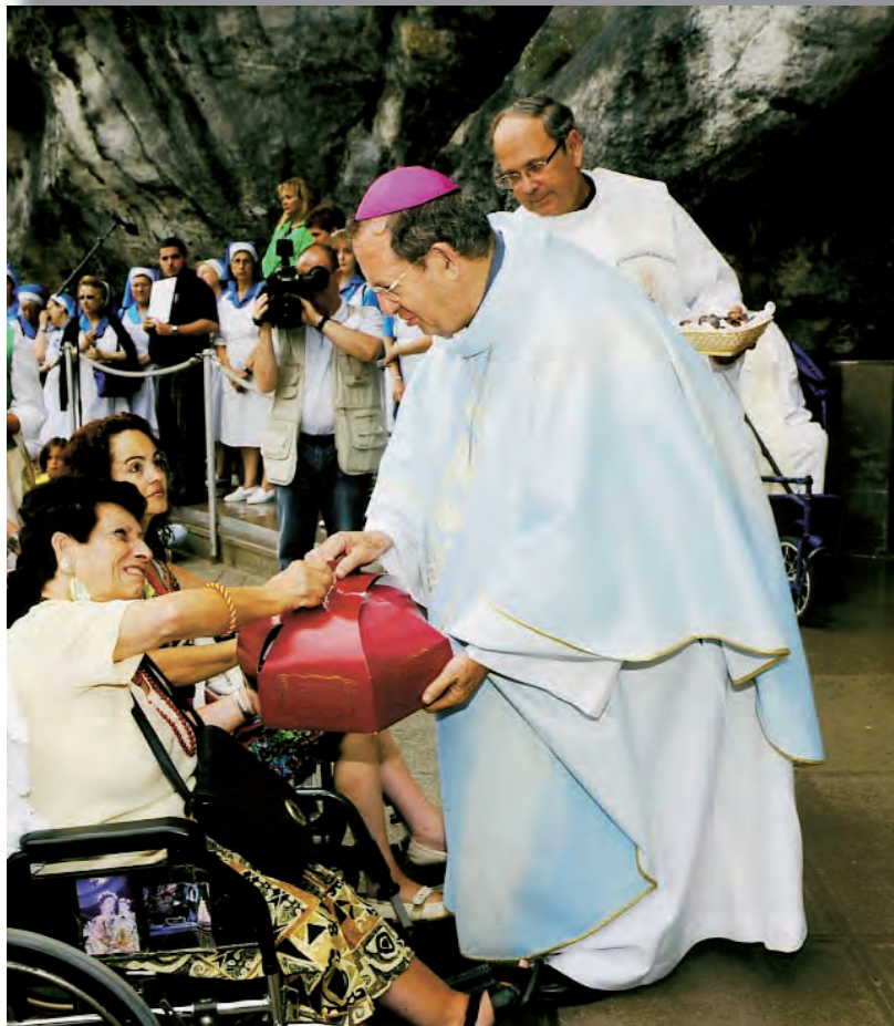
►D. Rafael en Lourdes acompaña a y saluda a los enfermos.

Desde el Consejo Pontificio de Pastoral de la Salud, se trabaja por garantizar el acompañamiento a los enfermos, la formación de los que acompañan y la programación de los servicios pastorales. Entre los grupos de enfermos