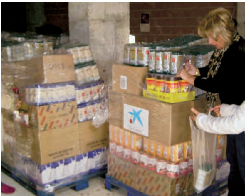
► Alimentos de primera necesidad esperando ser repartidos entre los más necesitados.