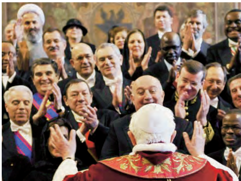
► El Papa saluda al cuerpo diplomático.