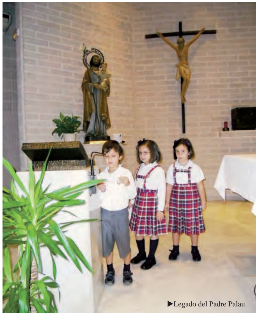
► Legado del Padre Palau.

Entre sus cualidades polifacéticas, el Padre Palau fue: fundador, misionero, escritor, director espiritual, exorcista... le destaca su frase: «Vivo y viviré por la Iglesia; vivo y moriré por ella» escrita en su libro «Mis Relaciones».