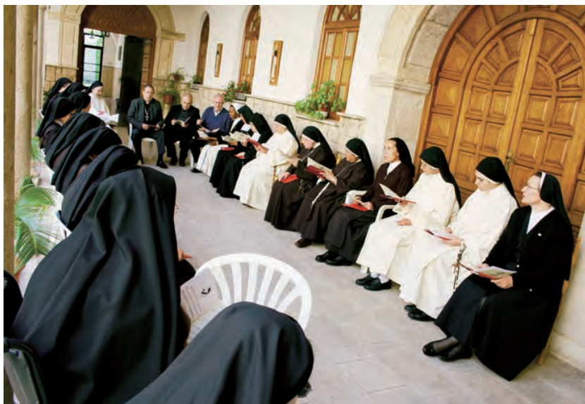
► I Encuentro de Contemplativas.