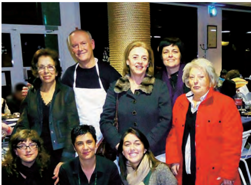
► Organizadores y beneficiarios en la noche de la cena.

Una iniciativa así, como es ofrecer nada más y nada menos que 100 cenas a personas y familias que no tienen apenas nada, sale de un gran corazón y así es como Paco, decidido