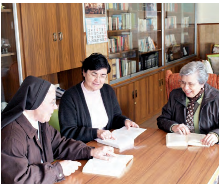
► Hermanas Carmelitas del Callosa.