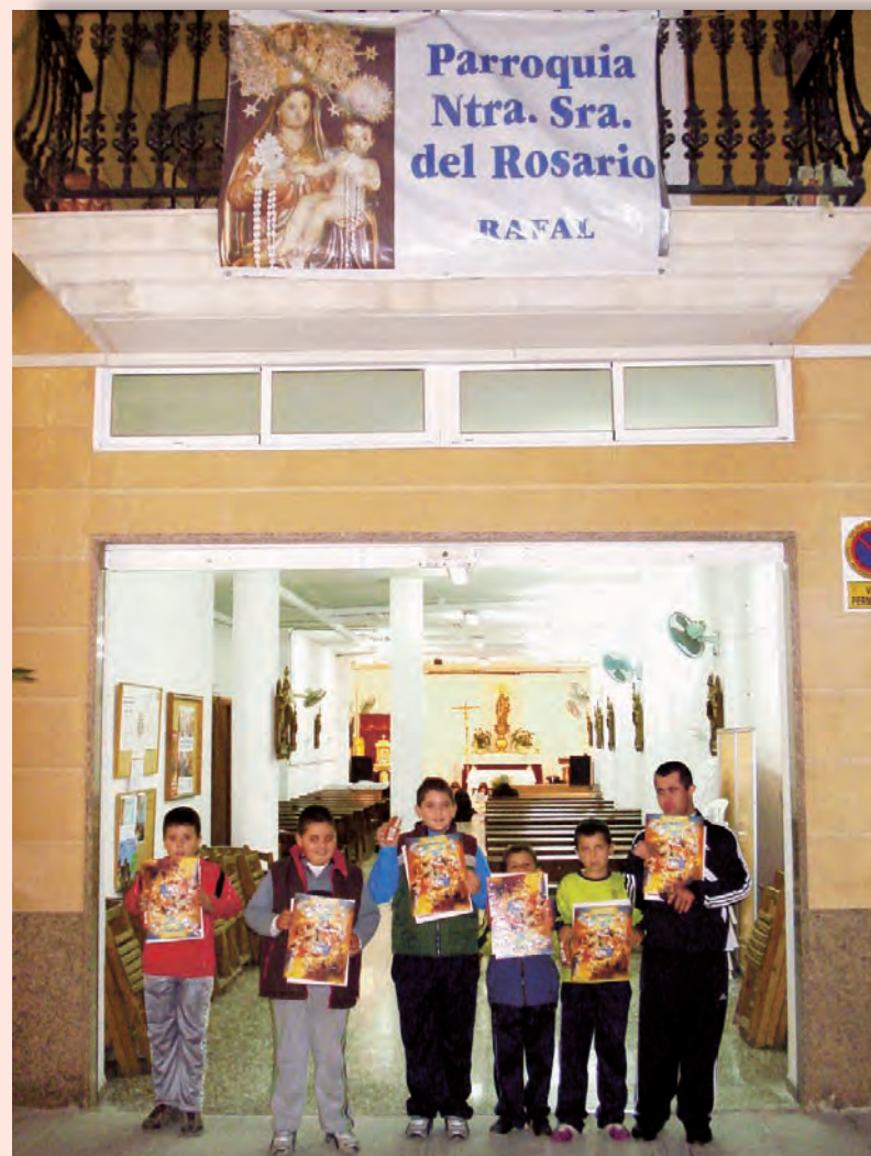
▼►Equipo de Monaguillos de la Parroquia Ntra. Sra. Del Rosario de Rafal.