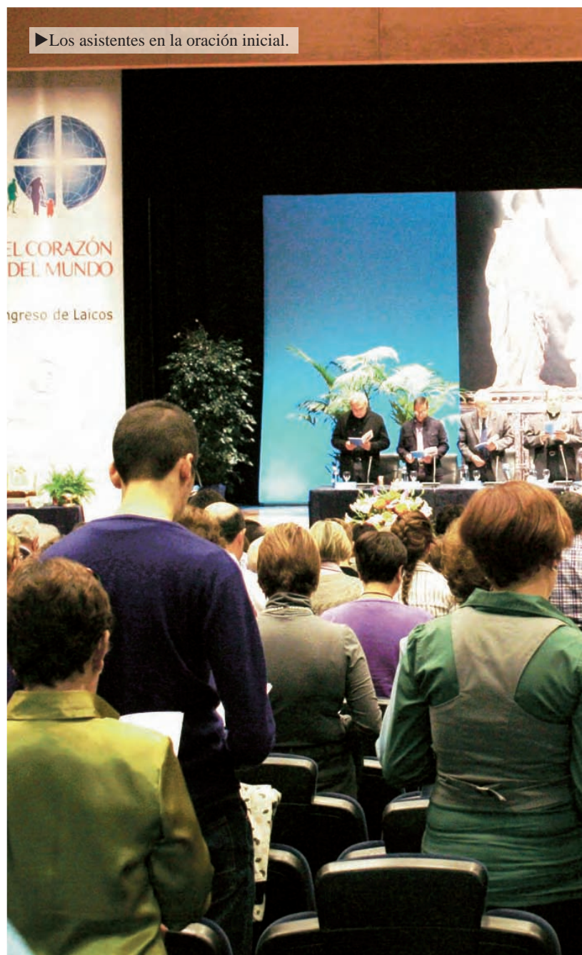
► Los asistentes en la oración inicial.

Comisión organizadora del Congreso de Laicos