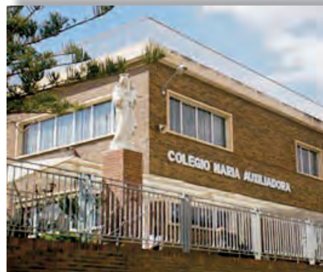
► Fachada del colegio María Auxiliadora de Alicante.

Actualmente somos una Comunidad formada por 17 hermanas, En nuestra Diócesis tenemos una única