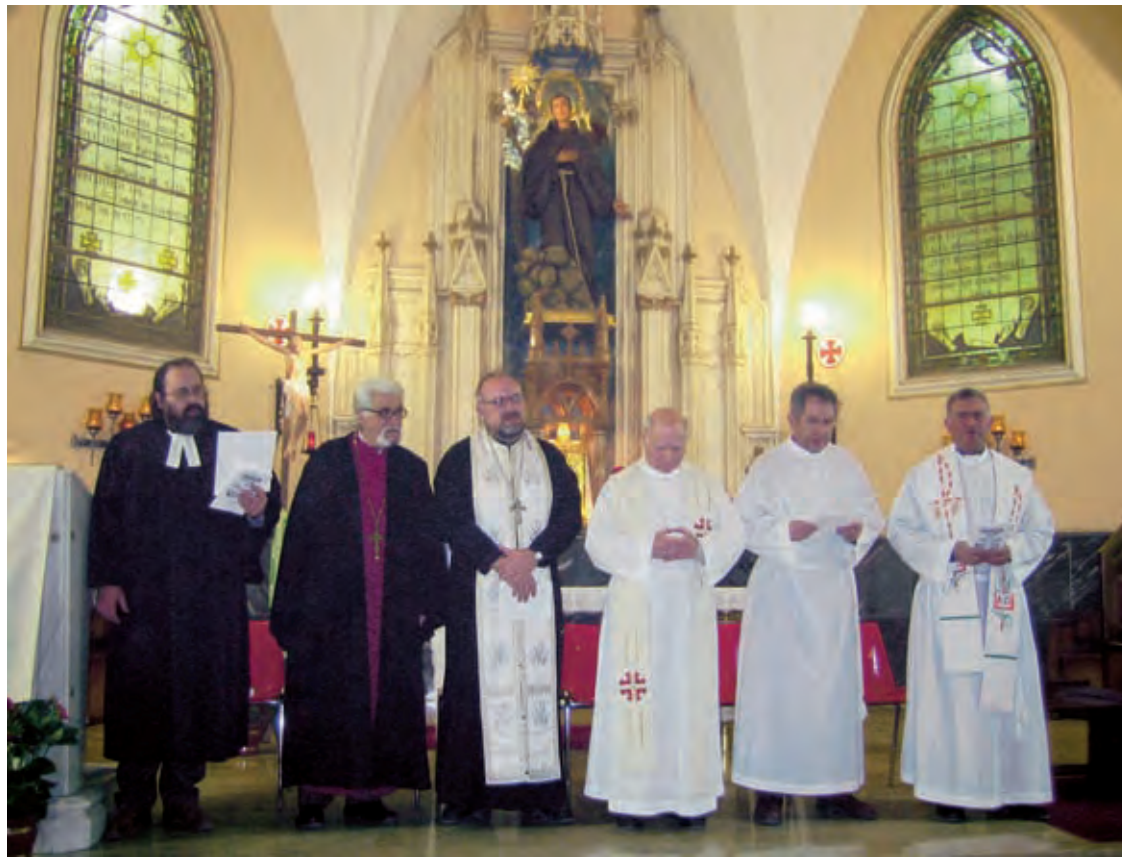
► Instante de una celebración del año pasado.

A través de esta actividad los diferentes grupos cristianos de la Diócesis de Orihuela-Alicante, muestran su mutuo interés y preocupación por lograr la unión, el respeto y la convivencia de los cristianos divididos no sólo en nuestra provincia sino en el resto del mundo.