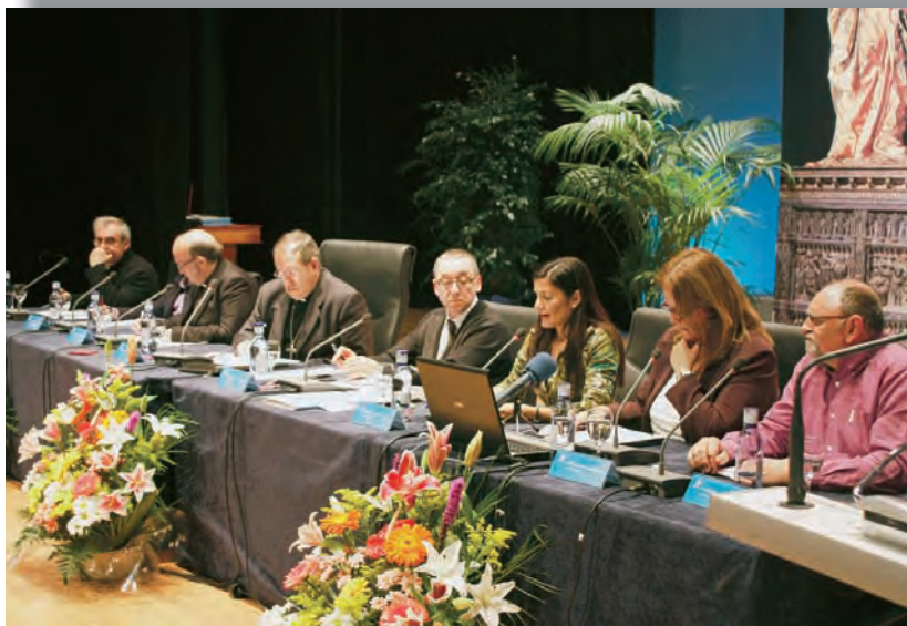
► Momento en el que se expone las síntesis de los talleres realizados.