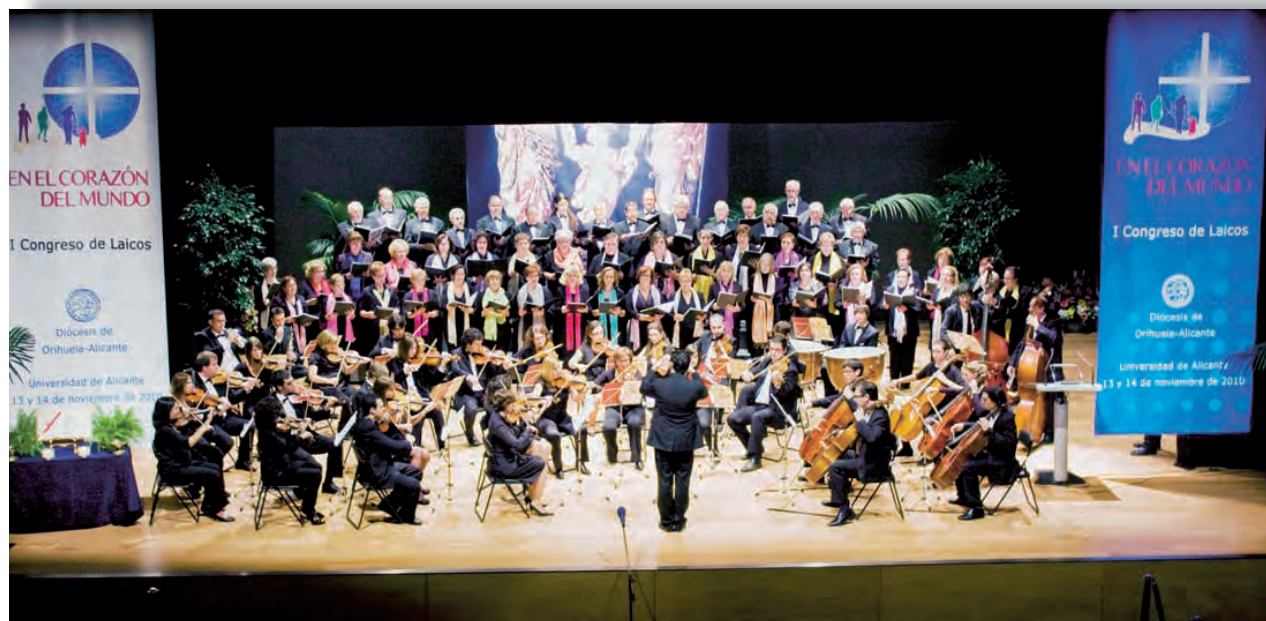
►Orquesta Sinfónica Académica San Vicente y Masa Coral La Aurora. Concierto en el Congreso de Laicos.