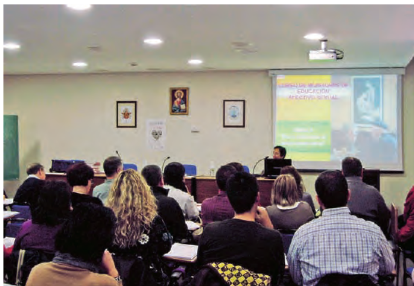
► Los asistentes al curso prestan atención ante las charlas.

¿Lo recomendarías a alguien? ¿a quién?: Sí, considero que este curso hay que fomentarlo en la familia, cristiana o no; en la vida parroquial con jóvenes y niños, así como en colegios, con la finalidad de dar a conocer la sexualidad del ser humano con su dignidad.