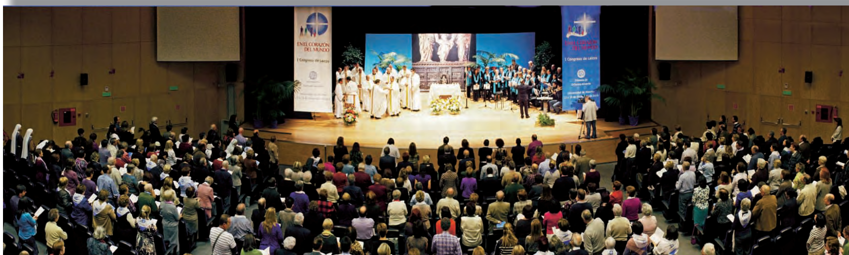
► Eucaristía de Clausura del I Congreso Diocesano de Laicos en el Paraninfo de la Universidad de Alicante.

Una vez concluido el Congreso de Laicos en la Diócesis de Orihuela-Alicante hemos querido recoger el sentir y la reflexión de los que han participado en el mismo. Tanto los trabajos previos como los desarrollados en los talleres han servido para escuchar la voz, las sugerencias y esperanzas de muchas personas involucradas en la tarea pastoral diocesana. Se constata en la diócesis de Orihuela-Alicante la presencia de un laicado deseoso de avanzar en su vocación laical y comprometido en su misión. El Congreso ha sido un regalo del Señor y una gozosa experiencia de comunión eclesial, que nos ha ayudado a comprender la importancia de la vocación y misión laical en este momento de la Iglesia y de la sociedad alicantina.