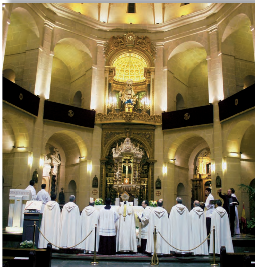
►Oración ante la Virgen del Remedio. Vigilia previa al Congreso de Laicos. Concatedral de San Nicolás.