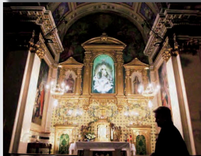
► Capilla de Santa Marta de la Vila.

heridas al muro de la Capilla, sobre también sus demás pinturas al fresco, su altar mayor y otros elementos como las decoraciones de pan de plata y oro y el marmolizado de las cornisas. Se procederá también a un estudio sobre el coste que supondría arreglar la cúpula de la misma que también cuenta con desperfectos. A las obras en Capilla de Santa Marta le seguirán otras para reformar esta iglesia fortaleza del siglo XVI que se encuentra en grave situación ya que una gran grieta recorre la cúpula principal y un muro de más de dos metros. Todos los esfuerzos serán pocos para evitar un mayor deterioro de este templo gótico renacentista declarado Bien de Interés Cultural por la Generalitat Valenciana en 2003.