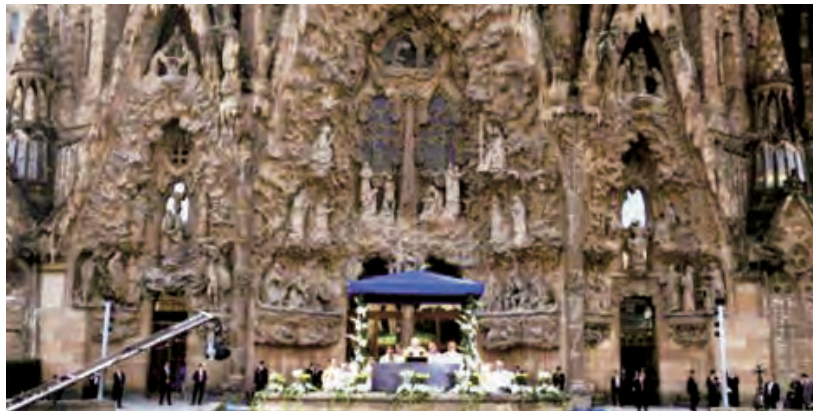
► Celebración de la Santa Misa oficiada por el Papa en la Sagrada Familia.

En este recinto, Gaudí quiso unir la inspiración que le llegaba de los tres grandes libros en los que se alimentaba como hombre, como creyente y como arquitecto: el libro de la naturaleza, el libro de la Sagrada Escritura y el libro de la Liturgia. Así unió la realidad del mundo y la historia de la salvación, tal como nos es narrada en la Biblia y actualizada en la Liturgia. Introdujo piedras, árboles y vida humana dentro del templo, para que toda la creación convergiera en la alabanza divina, pero al mismo tiempo sacó los retablos afuera, para poner ante los hombres el misterio de Dios revelado en el nacimiento, pasión, muerte y resurrección de Jesucristo. De este modo, colaboró genialmente a la edificación de la conciencia humana anclada en el mundo, abierta a Dios, iluminada y santificada por Cristo. E hizo algo que es una de las tareas más importantes hoy: superar la escisión entre conciencia humana y conciencia cristiana, entre existencia en este mundo temporal y apertura a una vida eterna, entre