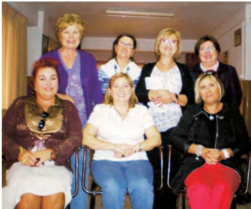
► Profesoras que impartirán los talleres.

Con esta iniciativa se quiere apoyar la promoción e integración social de las personas y/o familias en riesgo de exclusión social. Ante la realidad que tienen las mujeres inmigrantes que vienen a nuestro país y su necesidad de trabajo e integración social, se ha puesto en marcha un cursillo con el fin de dar un servicio pastoral a estas personas. El cursillo consiste en aprender las tareas básicas y fundamentales que se realizan en el hogar, para así poder acceder a un puesto de trabajo como empleadas de hogar o cuidadoras de niños y mayores. En los distintos talleres que se imparten se enseñan nuestras costumbres, ya que la mayoría de las mujeres proceden de países muy diversos; razón por la cual les resulta más complicado integrarse en la sociedad y encontrar un empleo. Este cursillo se complementa con un taller de «amistad y vida», donde hay un espacio para compartir la vida, fomentar la amistad, la autoestima, las relaciones sociales, personales y familiares. Todos tenemos necesi-