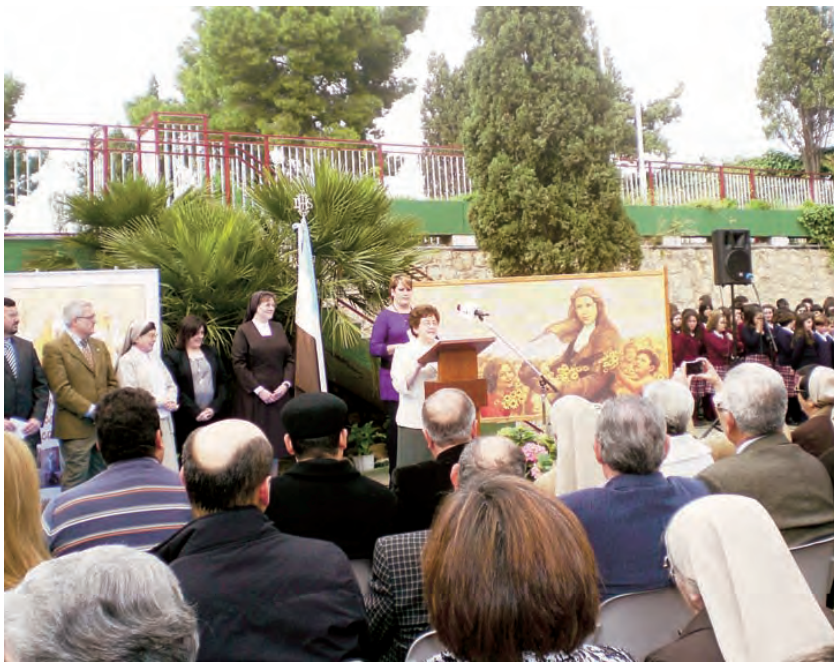
► Uno de los momentos de la celebración del 125º Aniversario.