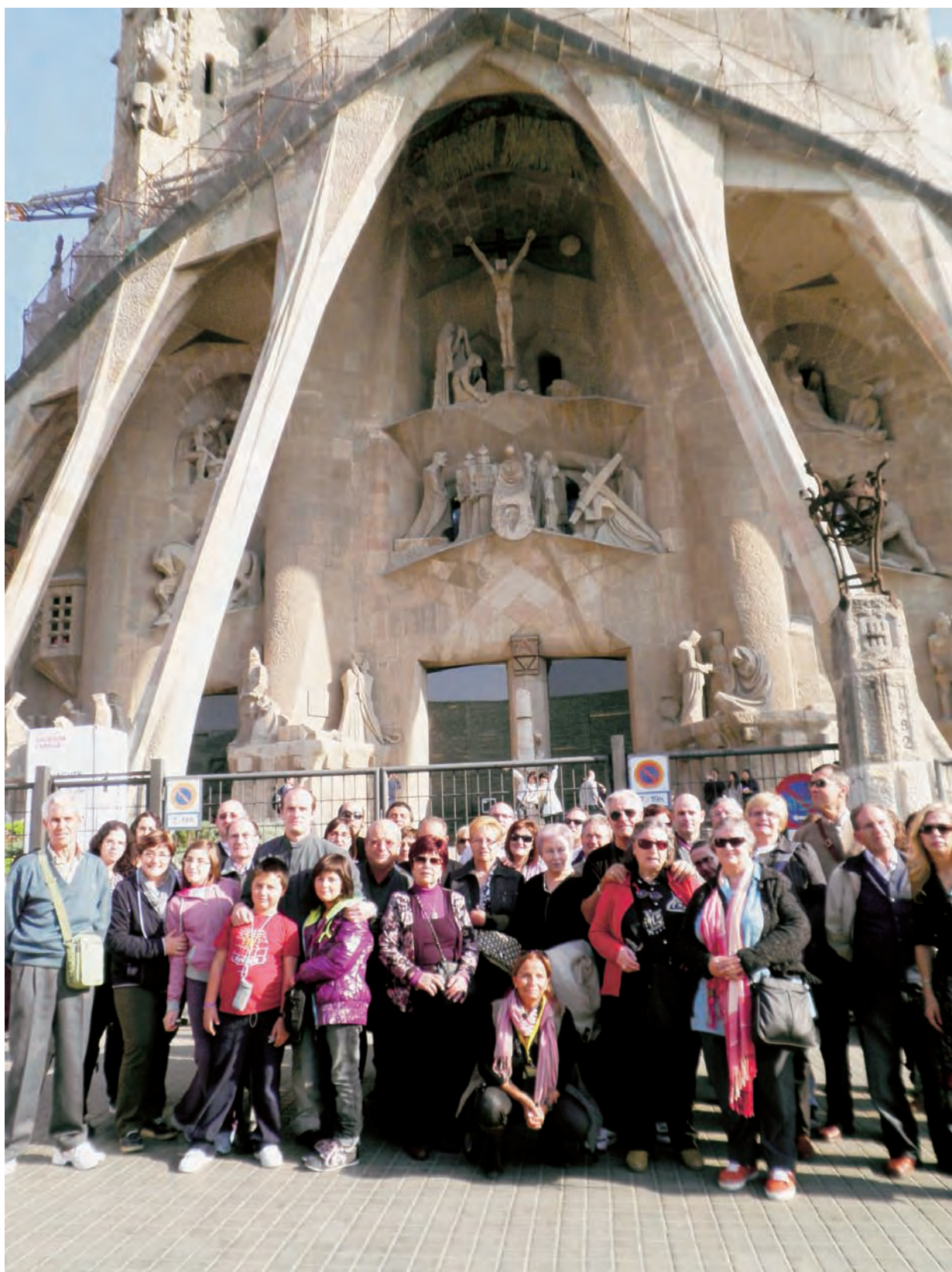
► Parte del grupo de nuestra Diócesis que viajó a la Ciudad Condal para acompañar al Santo Padre.