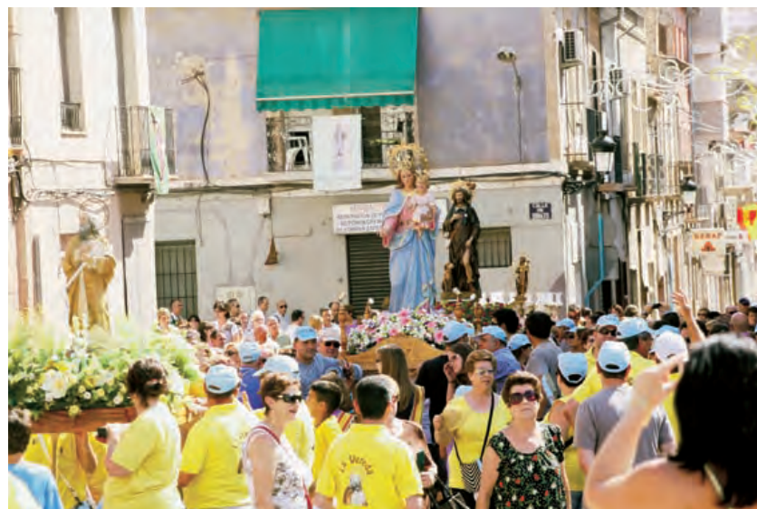
► Imagen de la romería de los distintos patronos de Novelda.

Y ese mismo quinto día, por la noche y después de alimentarnos con la eucaristía en la catedral de Santiago, de contemplar el botafumeiro, de abrazar al apóstol, de rezar ante sus restos y ganar el jubileo, tuvo lugar otro milagro. Esa noche, en el estadio de fútbol de San Lázaro, se celebró una vigilia presidida por el cardenal Stanislaw Rylko y ante la que doce mil jóvenes procedentes de todos los puntos de Europa rezaron, oraron, lloraron y cantaron unidos como un solo corazón. Dudo mucho que olvidemos algunos de los que allí nos encontrábamos el momento en el que entró la Custodia con el Santísimo y los doce mil jóvenes se arrodillaron al unísono, guardando un milagroso silencio. Una sola idea pasó entonces (y ahora) por mi cabeza: Dios está aquí. Y pasó un día y pasó una noche. El día quinto.