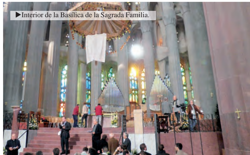
►Interior de la Basílica de la Sagrada Familia.