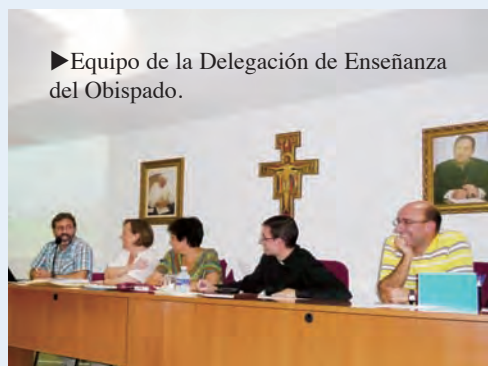
►Equipo de la Delegación de Enseñanza del Obispado.