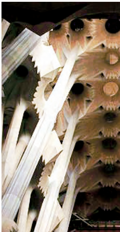
► Columnas del interior de la Basílica.

Este día es un punto significativo en una larga historia de ilusión, de trabajo y de generosidad, que dura más de un siglo. En estos momentos, quisiera recordar a todos y a cada uno de los que han hecho posible el gozo que a todos nos embarga hoy, desde los promotores hasta los ejecutores de la obra; desde los arquitectos y albañiles de la misma, a todos aquellos que han ofrecido, de una u otra forma, su inestimable aportación para hacer posible la progresión de este edificio. Y recordamos, sobre todo, al que fue alma y artífice de este proyecto: a Antoni Gaudí, arquitecto genial y cristiano consecuente, con la antorcha de su fe ardiendo hasta el término de su vida, vivida en dignidad y austeridad absoluta. Este acto es también, de algún modo, el punto cumbre y la desembocadura de una historia de esta tierra catalana que, sobre todo desde finales del siglo XIX, dio una pléyade de santos y de fundadores, de mártires y de poetas cristianos. Historia de santidad, de creación artística y poética, nacidas de la fe, que hoy recogemos y presentamos como ofrenda a Dios