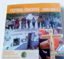
►Cuaderno de la Programación de la Pastoral Educativa 2010-11.