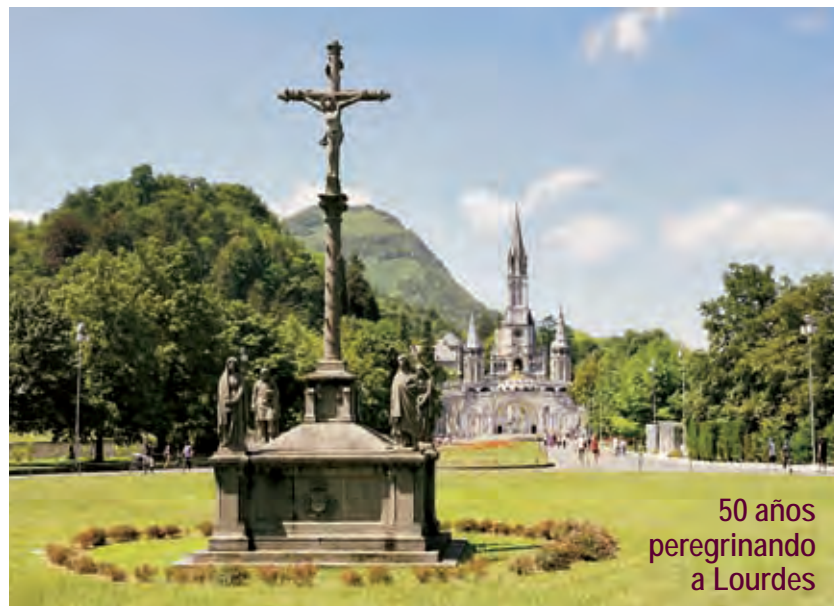
► Vista del Santuario de Lourdes.

poder continuar la peregrinación. Todos los entendieron y lo aceptaron, pero todos lloraron. Durante el camino recuerdo con especial emoción la llegada a una pequeña ermita, donde se encuentra un Cristo crucificado con una mano descolgada del madero y que la tiende a todo aquel que quiera tomarla. Creo que es una de las imágenes más poderosas que han quedado en mi memoria. Cena en Melide, descanso, ronda de canciones y confesiones multitudinarias en la plaza de la iglesia de esta ciudad. ¡Formemos un círculo y cantemos! La noche cae sobre nosotros, que a su vez caemos rendidos al sueño. Y pasó un día y pasó una noche. El día cuarto.