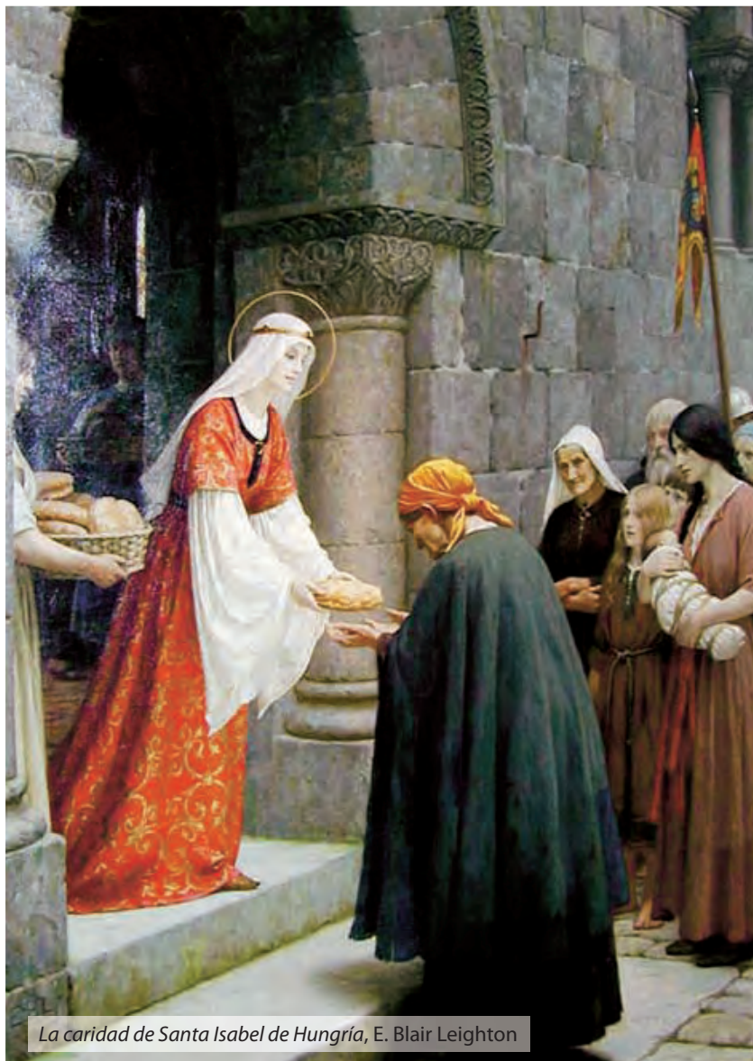
La caridad de Santa Isabel de Hungría, E. Blair Leighton

H oy quiero hablaros de una de las mujeres del Medioevo que ha suscitado mayor admiración; se trata de santa Isabel de Hungría, también llamada Isabel de Turingia.