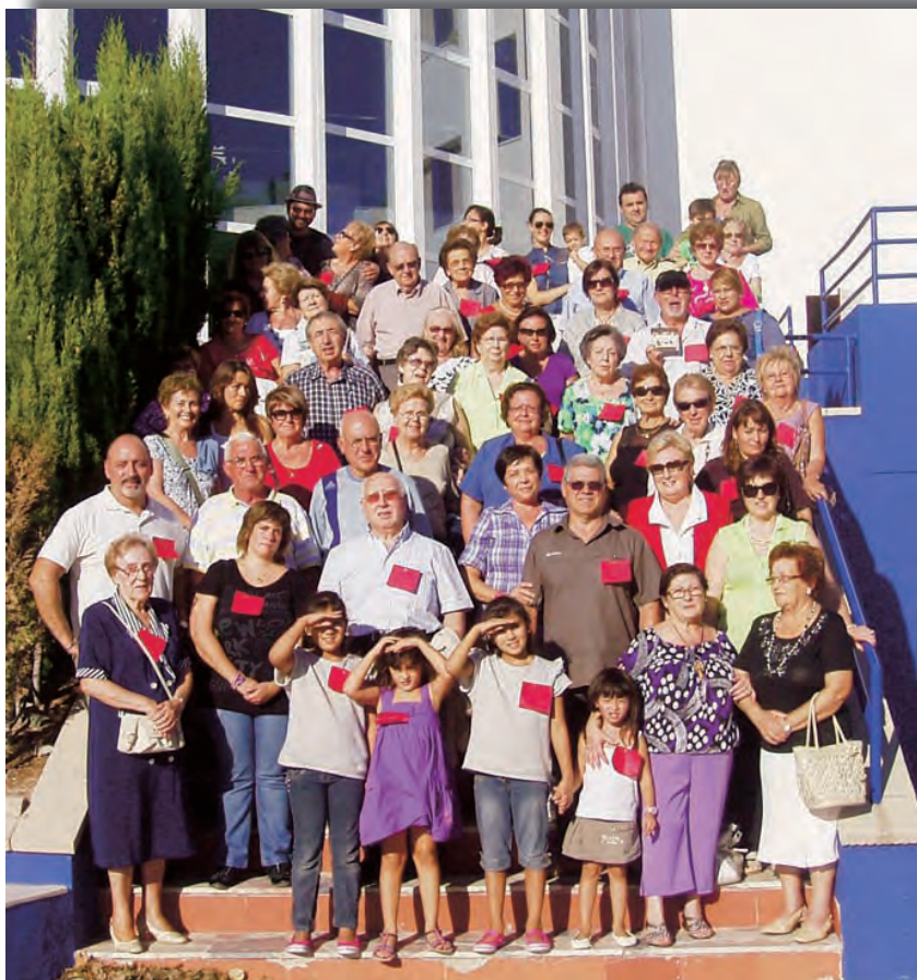
► Foto de los asistentes a la convivencia.

El pasado sábado 25 de septiembre, tuvo lugar la I Jornada de convivencia para voluntarios y socios de Cáritas Interparroquial de Elda . Es un acto que, tras mucho