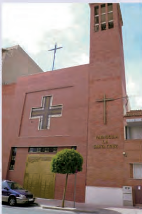
SÁBADO 23 DE OCTUBRE DE 2010 PARROQUIA DE LA SANTA CRUZ PETRER