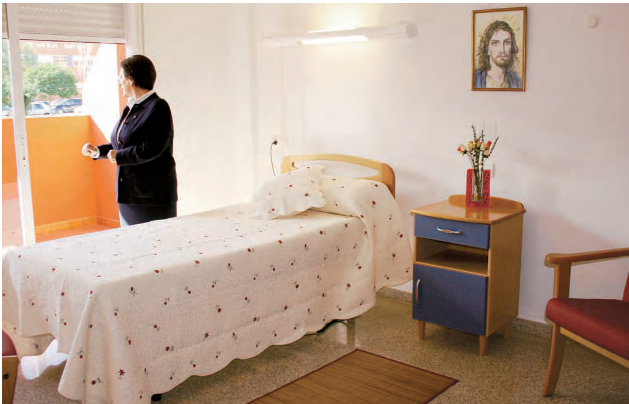
► Una de las habitaciones de las nuevas instalaciones.