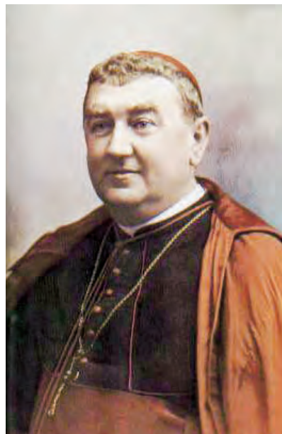
► Beato Manuel González.

Con razón ha escrito uno de sus biógrafos: «Se diría que no vivía más que para Él. En su presencia se hubiera pasado las horas si sus quehaceres no le arrancaran a cada momento del Sagrario... Sí, subrayo arrancaran porque había de hacerse una dulce violencia para apartarse de aquel rincón de su capilla, donde recibía para dar, y daba para seguir recibiendo más y más cada