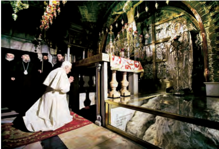
► Benedicto XVI ora en la Basílica del Santo Sepulcro

V enerados Hermanos, ilustres Señores y Señoras, queridos hermanos y hermanas!