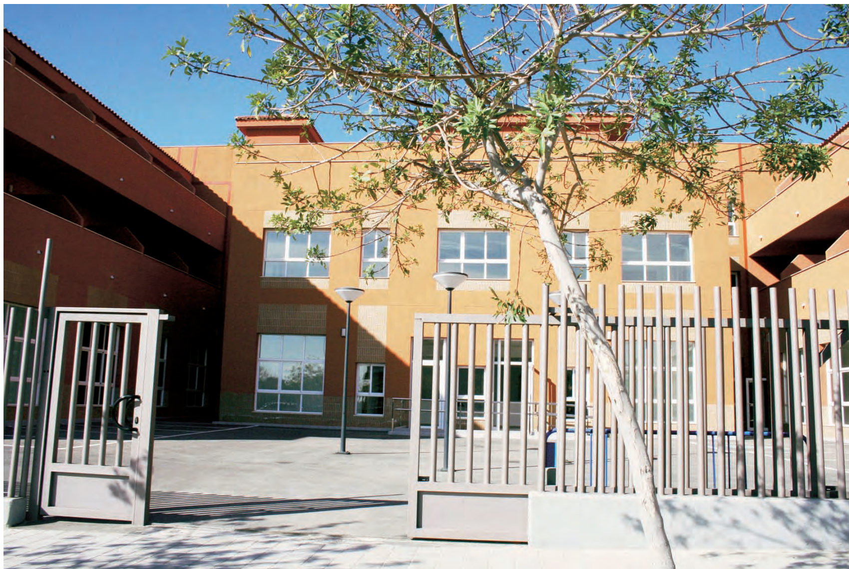
► Vista exterior de la nueva Residencia Virgen del Remedio.