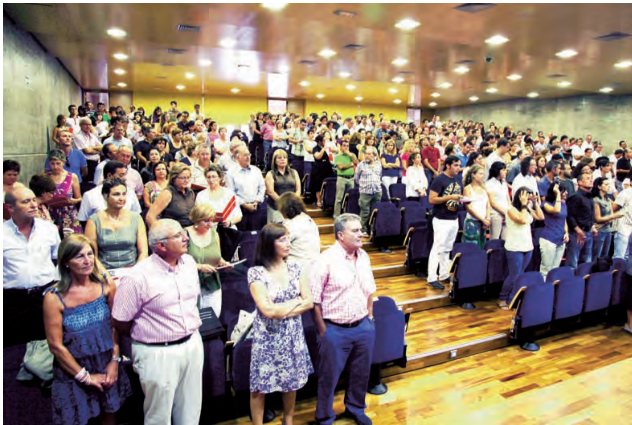
► Vista general del Salón de Actos del Obispado durante la Jornada.

Cerca de un millar de profesionales de la educación se dieron cita en el salón de actos del Obispado para celebrar la II Jornada de Colegios Diocesanos. Bajo el lema «Educadores en los Colegios Diocesanos: fortaleciendo la identidad» se dieron cita tanto profesores como miembros de las directivas y personal administrativo de los diez centros diocesanos de Orihuela-Alicante.