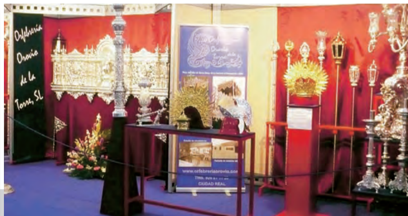
Exposición de los artículos de la Semana Santa.