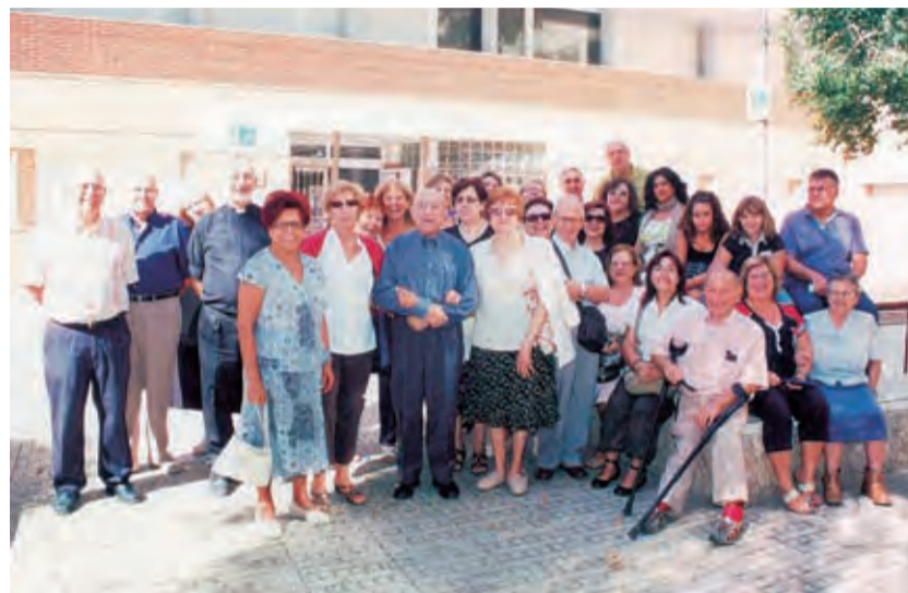
► Foto del grupo reunido.

... desde el voluntariado de Radio María, nos esforzaremos por llegar casa por casa, familia por familia, ciudad por ciudad anunciando la Salvación de Cristo y su paz al mundo