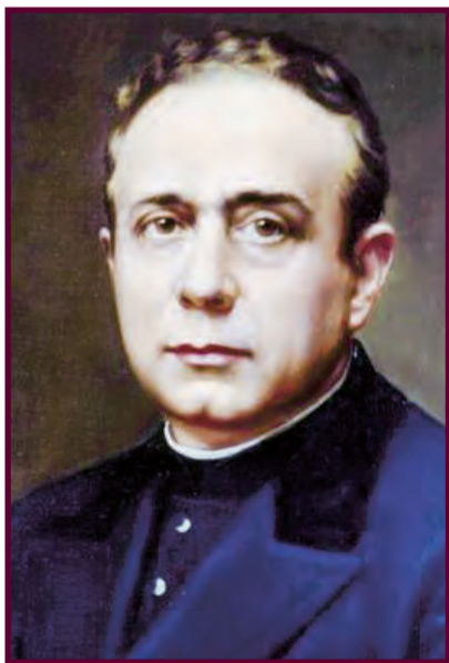
► San Pedro Poveda

El diálogo entre la fe y la cultura es una de las líneas fuertes de muchas organizaciones católicas que tienen una presencia significativa en el campo cultural. La Institución Teresiana (I.T.) es una Asociación Internacional de laicos fundada en 1911 por San Pedro Poveda , que quiere colaborar en la misión evangelizadora de la Iglesia a través de la promoción humana y transformación social, mediante la educación y la cultura, con una espiritualidad de encarnación, centrada en el misterio del Dios hecho hombre.