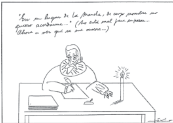
Máximo en El País