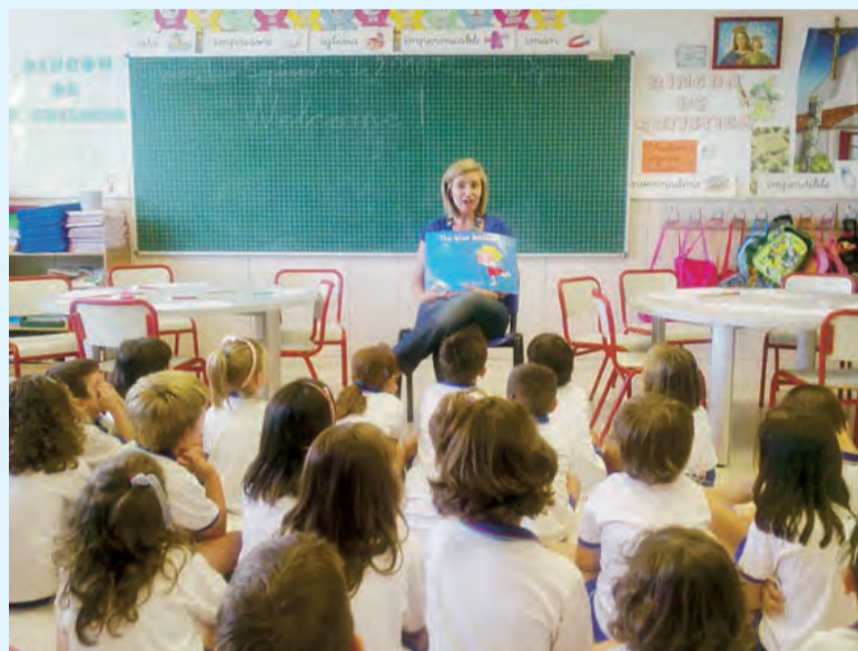
► En una clase de infantil comienzan con las dinámicas.

E l Colegio Diocesano Oratorio Festivo de San Miguel, en Orihuela, abre sus puertas este curso con novedades en las aulas. Por primera vez un centro de la localidad pone en marcha un PIP (Programa de Incorporación Progresiva al Valenciano) junto a un proyecto plurilingüe. La Conselleria de Educación de la Generalitat Valenciana ha resuelto dar su aprobación al plan solicitado por el Oratorio Festivo de aunar y poner en marcha de forma integrada dos proyectos educativos, uno de plurilingüismo y otro de incorporación progresiva al valenciano.