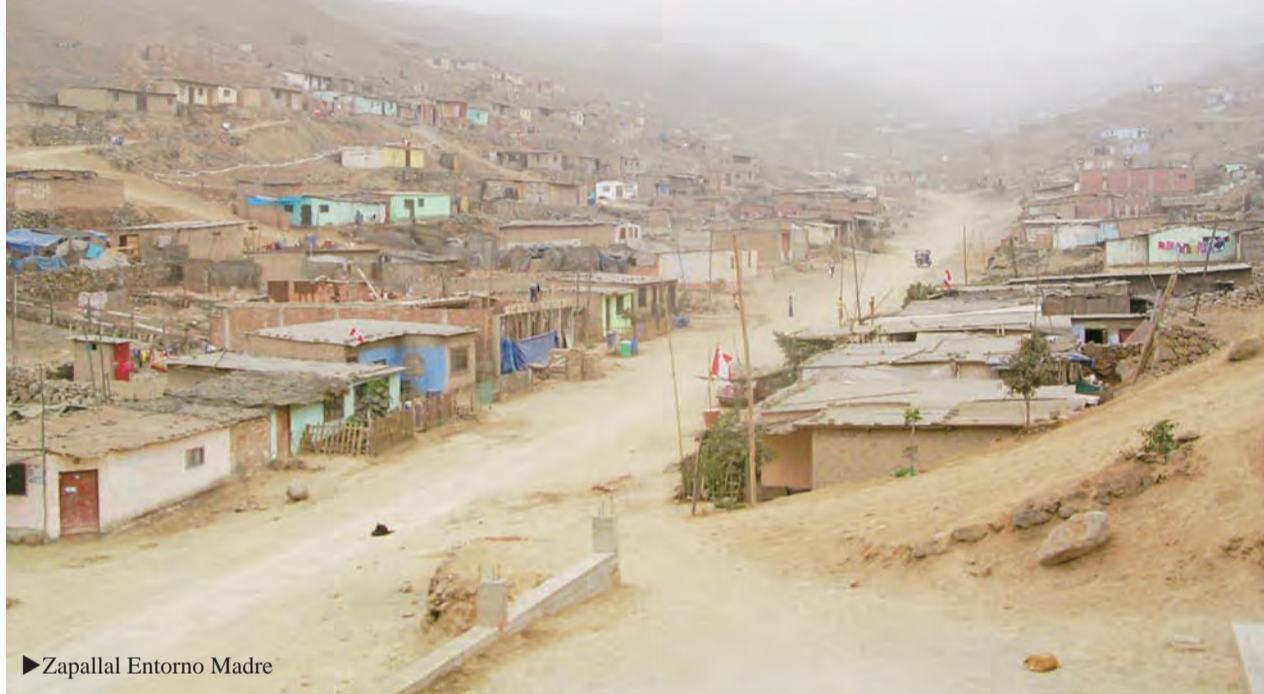
► Zapallal Entorno Madre

E l verano pasado tuve la ocasión de visitar nuestras Diócesis hermanas de Chimbote y de Carabayllo en Perú. Pude conocer a buena parte del clero de ambas Diócesis, pues dirigí sus Ejercicios Espirituales. Conocí especialmente de cerca el trabajo que realizan allí nuestros sacerdotes y laicos. Con esta crónica quiero agradecer su dedicación y la acogida que me ofrecieron.