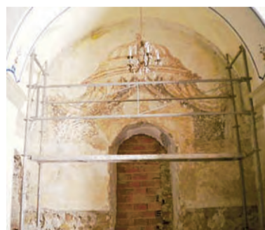
► Imagen del hallazgo.

La restauración de la iglesia de Nuestra Señora del Carmen de Cox está permitiendo conocer de forma exhaustiva la construcción original del templo. Las catas realizadas en los paramentos del interior del edificio han puesto de manifiesto la policromía original, al descubrirse restos