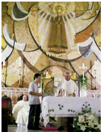
►Momento de la Eucaristía.