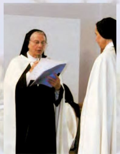
►La Hna. M a Auxiliadora en su día Jubilar

Tenemos la suerte de «pertenencia», de encontrar casa y herman@s a donde quiera que vayamos. Esto es fruto de la Madre que nos fundó, que con un corazón apostólico y misionero extendió su obra y nos complementó fundando a los Carmelitas Descalzos. Vivo una vocación común y solidaria con toda la Orden, de la