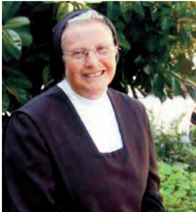
►La Hna. M a Auxiliadora del Espíritu Santo