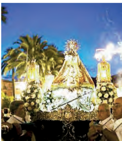
► Momento de la procesión.

...las visitas guiadas a grupos tuvieron como punto de referencia principal, además de la Catedral en su V centenario, la historia de la Virgen de Monserrate y su vinculación con la Catedral de Orihuela