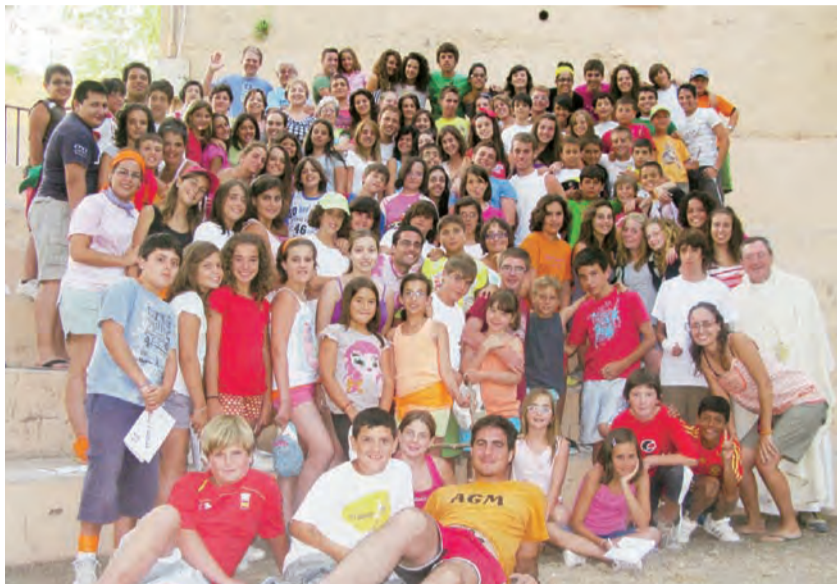
► Monitores y niños que participaron en el campamento.

Una vez más, y ya son dieciséis años, la parroquia de San Bartolomé ha organizado el campamento de verano para niños de entre 9 y 16 años. Han sido alrededor de ochenta y seis los que han participado en esta experiencia. El campamento se iniciaba el pasado lunes 12 de Julio cuando todos estábamos aún resacosos de ver a España campeona del mundo de fútbol. Ese día, alrededor de las nueve y media de la mañana, tres autobuses partían cargados con niños, monitores, cocineras y un montón de ilusiones hacia el albergue marista de Fontalbres, situado en pleno Puerto de Biar. Nada más llegar se planteó la historia sobre la que iba a girar todo el campamento: alguien había abierto la Caja de Pandora y se habían escapado todos los males. El trabajo de los niños consistía en ir recuperando esos males y volverlos a meter dentro de la Caja para que no hicieran daño a la humanidad. Teniendo como telón de fondo ese argumento, durante los diez días se desarrollaron juegos que intentaban hacer que los niños se lo pasasen bien y que aprendiesen valores humanos y cristianos. El día siempre empezaba con una oración. La bendición del desayuno, comida y cena nunca faltaba, así como la oración del final del día antes de ir a dormir. Además, todos los días había celebración de la Eucaristía voluntaria para quien quisiera ir. Uno de los momentos más esperados del día era la hora del baño, donde niños y monitores, disfrutaban de un agradable chapuzón. El resto del día se